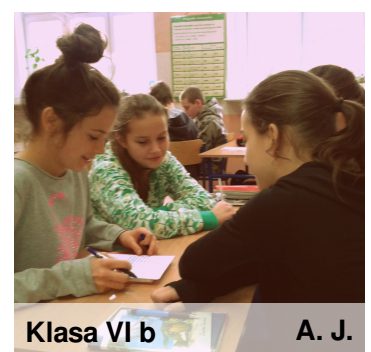
Klasa VI b

O tym dlaczego należy przestrzegać prawa, co o tym sądzą uczniowie oraz o projekcie Bezpieczna Szkoła, w którym bierze udział "Czterdziestka" przeczytacie na stronie 2. Tam również fotorelacja z klasowej lekcji prawa w IV b i VI b.