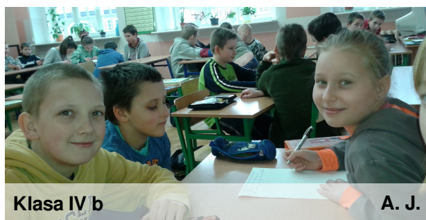
Klasa IV b