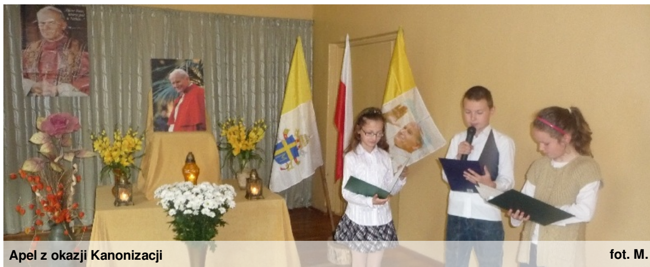
Apel z okazji Kanonizacji