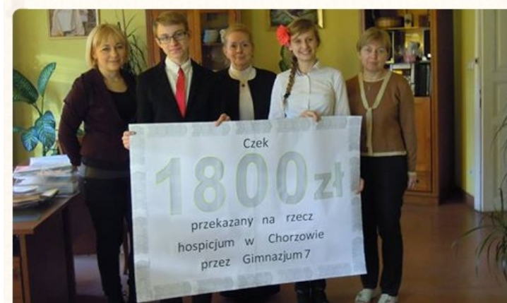
Czek na hospicjum