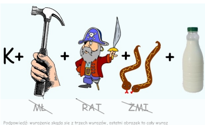
Podpowiedź: wyrażenie składa się z trzech wyrazów, ostatni obrazek to cały wyraz

Blondynka odpowiada: - Na 6 bo 12 nie zjem