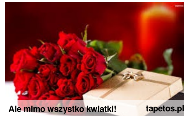
Ale mimo wszystko kwiatki!