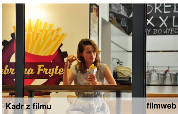
Kadr z filmu