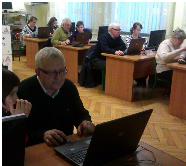
Na spotkanie przyszło sporo osób