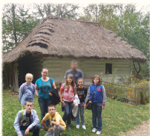
Nasi redaktorzy

Tej wiosny postaw na pastelowe opaski. Będą pasowały do rozpuszczonych włosów. Modne będzie wpinanie we włosy zdobionych grzebieni naszych babć. To wszystko wiosną będzie dozwolone na twojej głowie