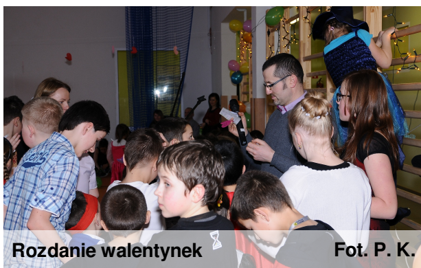
Rozdanie walentynek