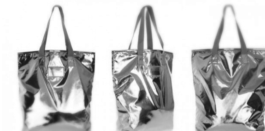
Torba XXL + metaliczny połysk

Biała koszula – must have Niektóre ubrania po prostu musisz mieć w swojej szafie – jedną z takich rzeczy jest właśnie biała koszula.