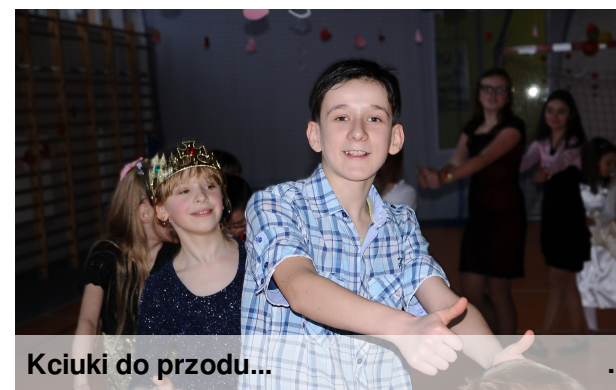
Kciuki do przodu...