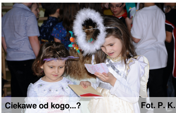
Ciekawe od kogo...?