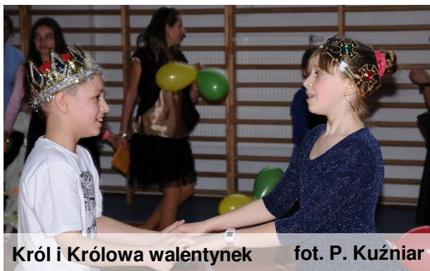
Król i Królowa walentynek