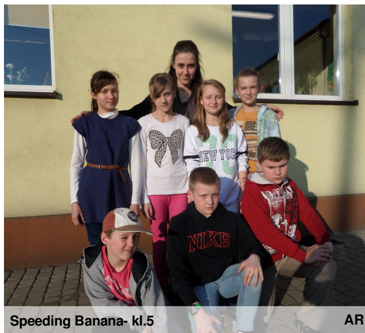
Speeding Banana- kl.5