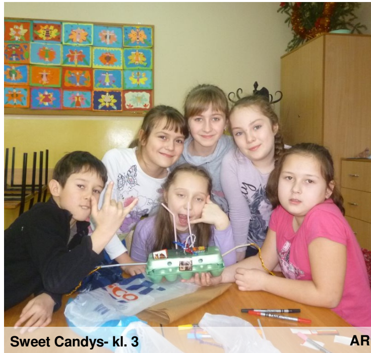
Sweet Candys- kl. 3

Oprac: K. Rzepka, kl. 3, E. Pospuła, kl. 5