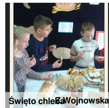
Święto chleba Wojnowska

Co roku w naszej szkole organizujemy Święto Chleba. Dziękujemy w ten sposób wszystkim tym, którzy przyczynili się do jego powstania. Próbowaliśmy też zemleć ziarna zbóż przy pomocy kamieni. Jedliśmy też wypieki naszych mam.