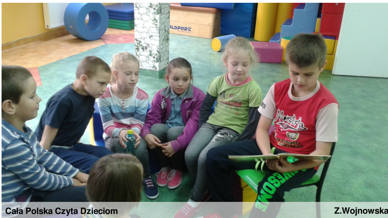
Cała Polska Czyta Dzieciom