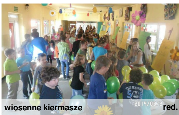
wiosenne kiermasze red.