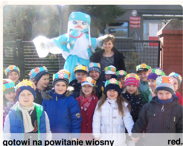
gotowi na powitanie wiosny red.