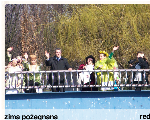
zima pożegnana red.