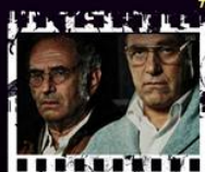
DUŻE ZŁE WILKI