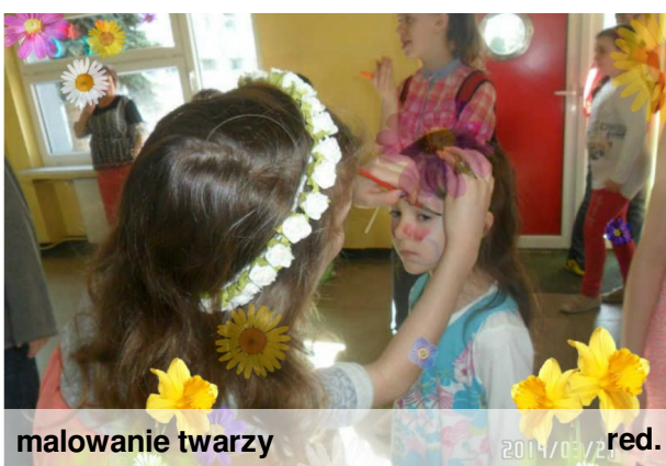
malowanie twarzy red.

Jak co roku celebrowaliśmy Dzień Wiosny . Samorząd zaplanował na ten dzień wiele zabaw i atrakcji dla uczniów oraz nauczycieli naszej szkoły. Jak zwykle przy takich imprezach gromadzimy się na przewidzianej. Na co dzień jest to punkt spotkań trzecioklasistów. W tym dniu ustąpili miejsca dziewczynom, które przygotowały dla nas m. in. wiosenne loterie. Najmłodszy korzystali najchętniej z malowania twarzy. Pomyśleliśmy również o stronie kulinarnej tej imprezy. Komu burczało w brzuchu, mógł się poratować rzodkiewką, jabłuszkami lub marchewką. Zadbano o aktywnych sportowo. Młodzi sportowcy brali udział w turniejach piłki nożnej, koszykówki oraz siatkówki. Największą furorę zrobiło karaoke poprzedzone akademią z okazji Dnia Patrona, w której brali udział niektórzy członkowie naszej redakcji. Wiosna zawitała na dobre. Nie tylko w kalendarzu, ale i w naszych głowach.