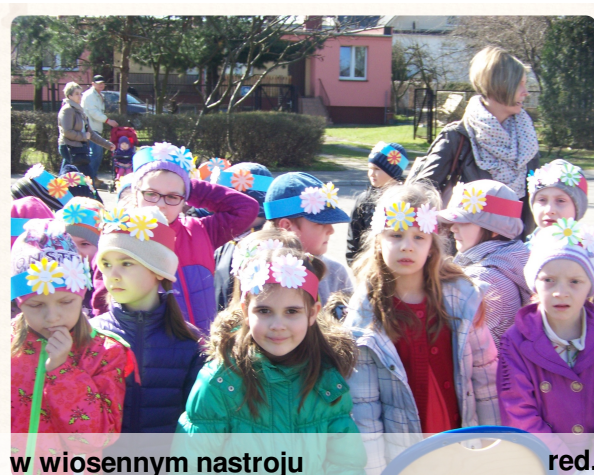
w wiosennym nastroju red.