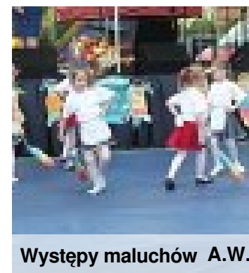
Występy maluchów A.W.

To już nasza szkolna tradycja. W kolejną rocznicę nadania imienia Jana Pawła II naszemu gimnazjum bawimy się na szkolnym festynie. W tym roku zapraszamy w godz.:14- 19. Mamy mnóstwo atrakcji, o tym obok na plakacie. Liczymy na Waszą hojność.