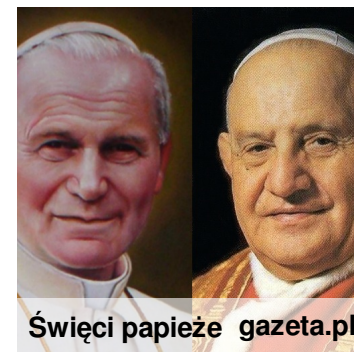
Święci papieże