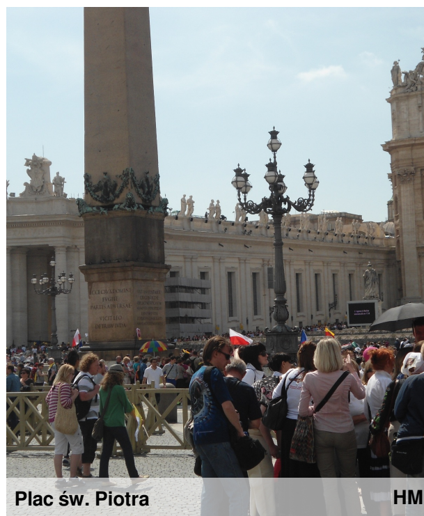
Plac św. Piotra