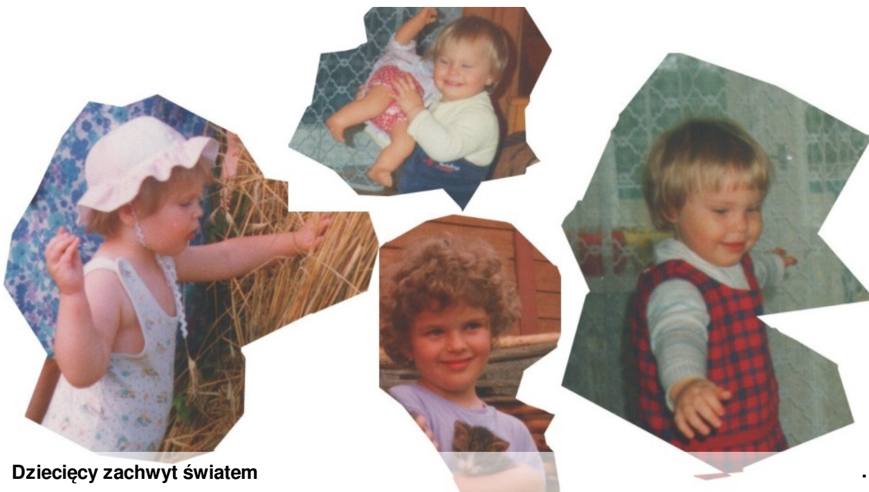
Dziecięcy zachwyty światem

Każde dziecko na świecie jest takie samo,