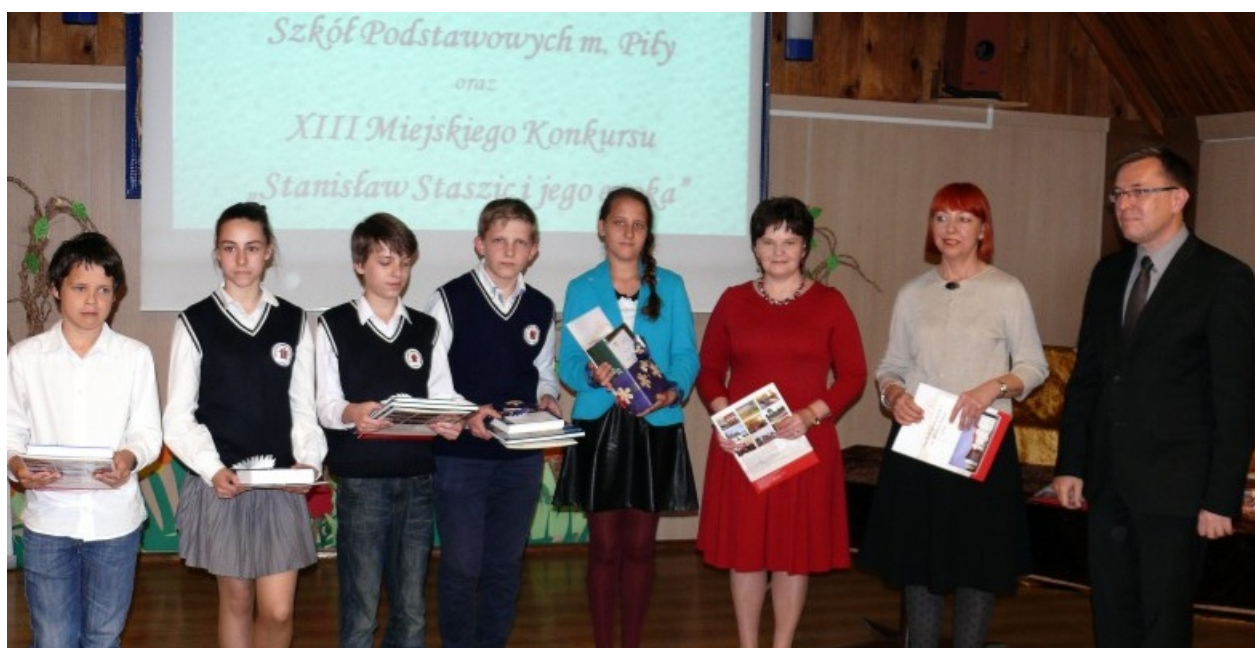
Laureaci z polonistkami i prezydentem Pily