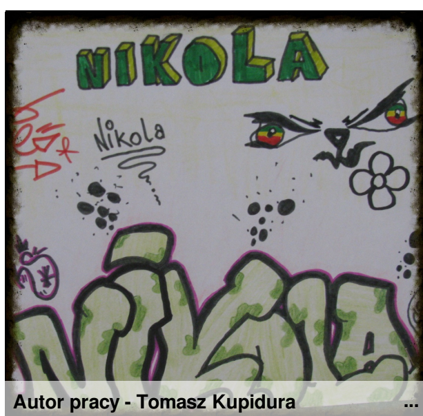
Autor pracy - Tomasz Kupidura