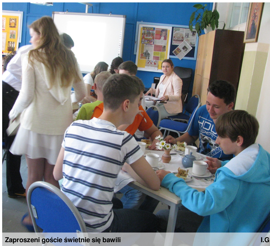
Zaproszeni goście świetnie się bawili