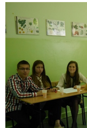
Warsztaty SU PG 11