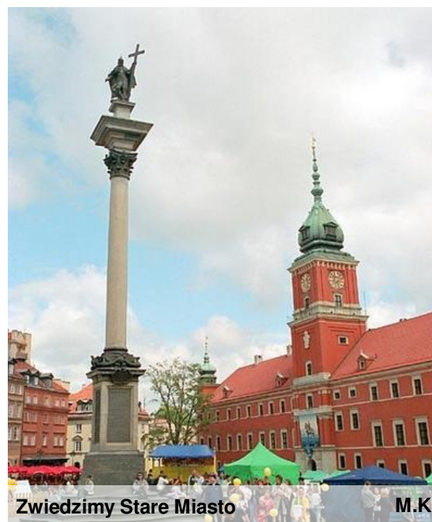
Zwiedzimy Stare Miasto