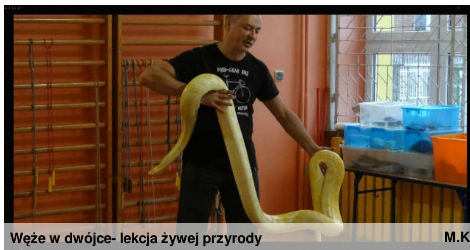
Wężę w dwójce- lekcja żywej przyrody