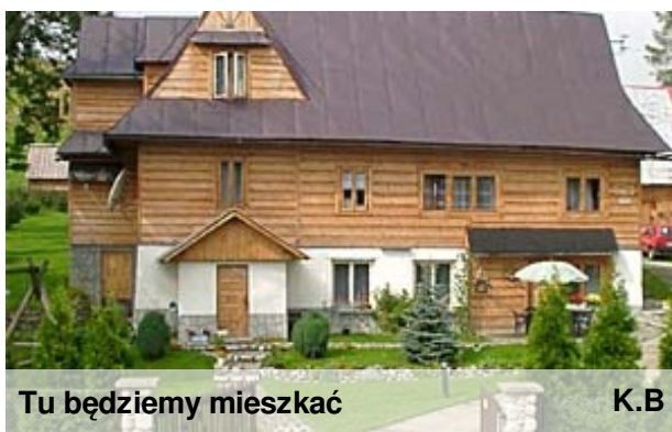
Tu będziemy mieszkać

Ale jest przecież taka sama tylko ,że dużo ładniejsza.