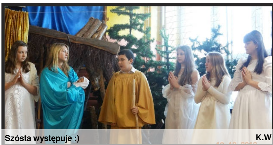
Szósta występuje :)