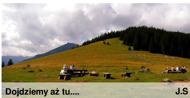
Dojdziemy aż tu....