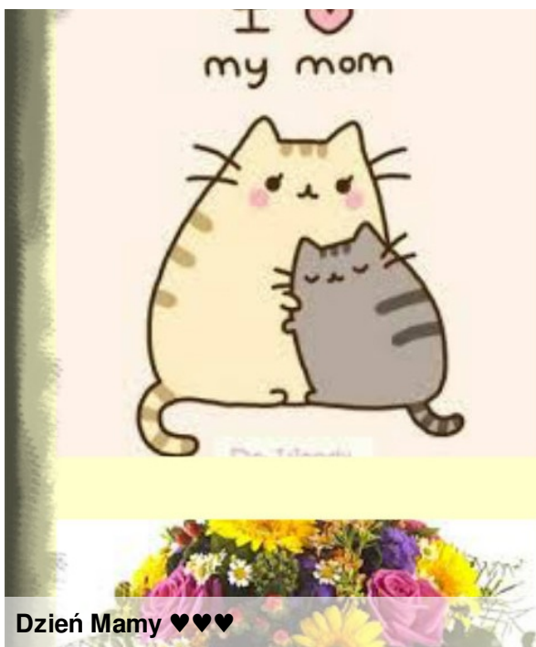
Dzień Mamy ♥♥♥