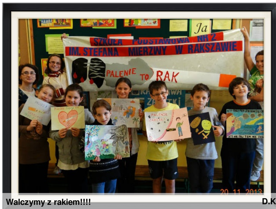
Walczyliśmy z rakiem!!!!