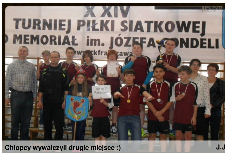
Chłopcy wywalczyli drugie miejsce :)