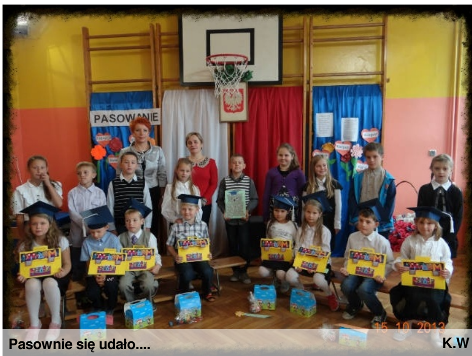
Pasownie się udało....