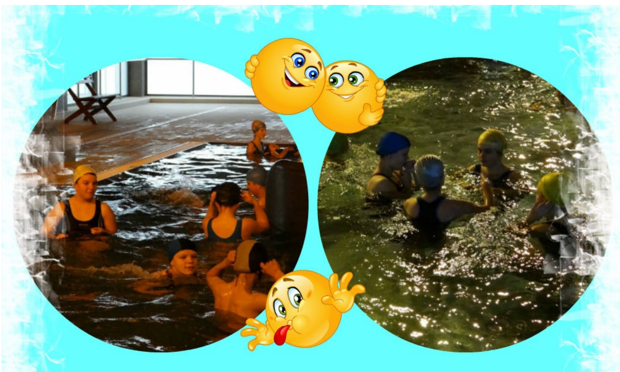
Podczas zajęć :D