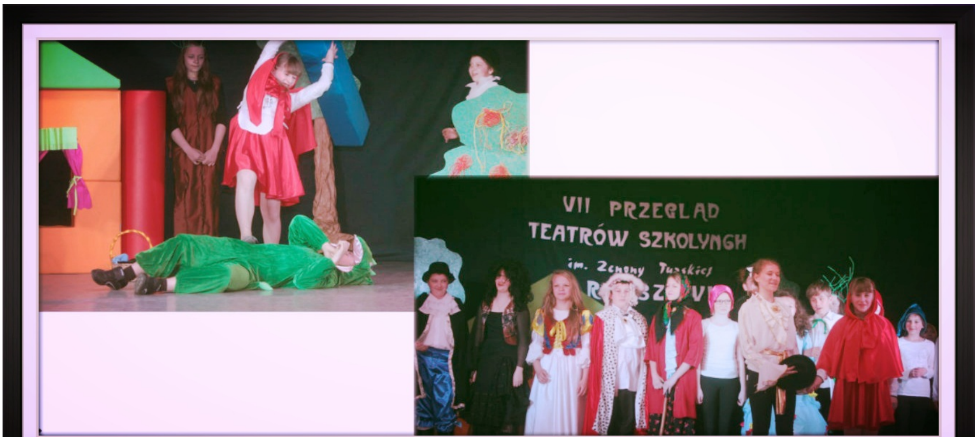
Nasze przedstawienie :P