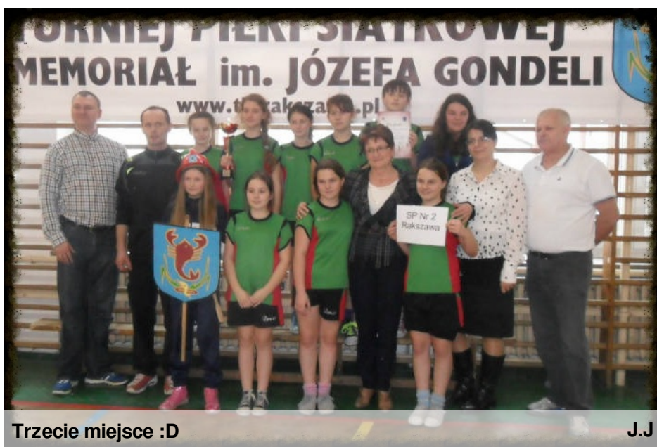
Trzecie miejsce :D