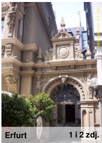
Erfurt 1 i 2 zdj.