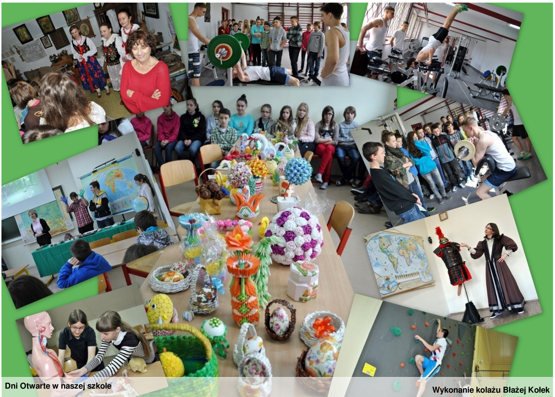
Dni Otwarte w naszej szkole