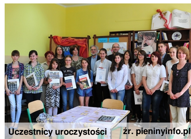
Uczestnicy uroczystości

22 maja w Publicznym Gimnazjum w Szczawnicy nastąpiło otwarcie wystawy prac wykonanych w Międzyszkolnym Konkursie Plastycznym oraz rozdanie nagród zwycięzcom. Konkurs został ogłoszony przez bibliotekę szczawnickiego gimnazjum, w związku z Rokiem Czytelnictwa.