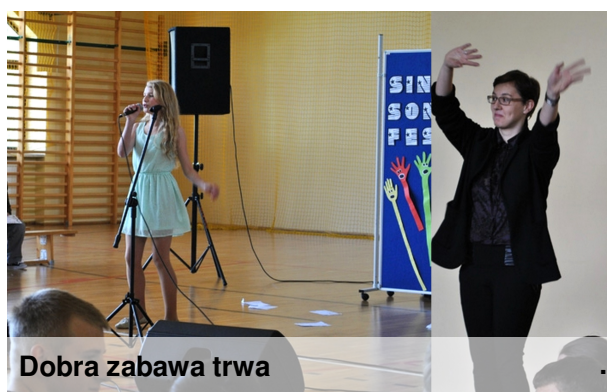
Dobra zabawa trwa

Konkurs odbył się 9.05. Jego organizatorami byli już po raz trzeci nauczyciele języków obcych Publicznego Gimnazjum w Krościenku n.D. Nagrody zostały ufundowane przez wydawnictwo Macmillan oraz Radę Rodziców.