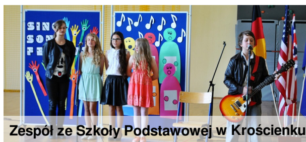
Zespół ze Szkoły Podstawowej w Krościenku