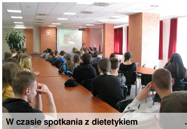
W czasie spotkania z dietetykiem

„TRZYMAJ FORMĘ” to akcja organizowana przez PAŃSTWOWĄ INSPEKCJĘ SANITARNĄ . W ramach akcji, do której przystąpiła nasza szkoła, klasy III uczestniczyły m. in. w prezentacji na temat zdrowego odżywiania, która znalazła się w bogatym programie Dnia Otwartego w Pienińskiej Szkole Zawodowej w Szczawnicy.