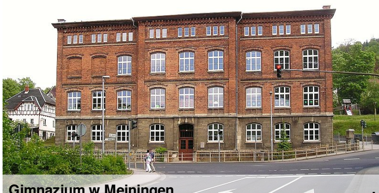
Gimnazjum w Meiningen