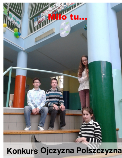
Konkurs Ojczyzna Polszczyzna

Książka pomaga nam rozwijać język i słownictwo. Uczy nas wyrażać myśli i rozumieć innych. Pobudza fantazję, uczy budować obrazy w wyobraźni. Książka może stawiać pytania, które angażują i pobudzają do dalszych przemyśleń. Książka to spotkanie z nieograniczonym światem - podjęliśmy wyzwanie i stanęliśmy do konkursu pod patronatem prof. J. Miodka, żeby sprawdzić, czy już potrafimy za pomocą słów stworzyć interesujący świat i ze swadą go przedstawić.