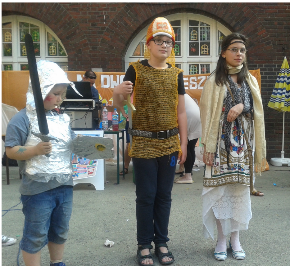
Zwycięzcy konkursu na najlepszy strój