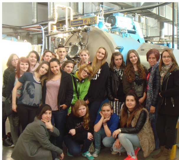
W ZAKŁADACH KANAKA W ŁODZI