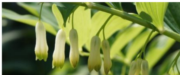
fot. Ilona Ryżak