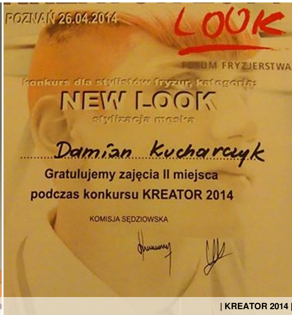
| KREATOR 2014 |