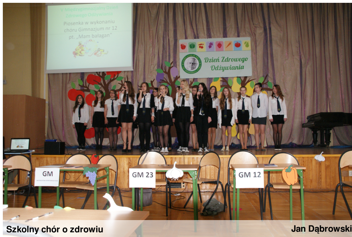
Szkolny chór o zdrowiu