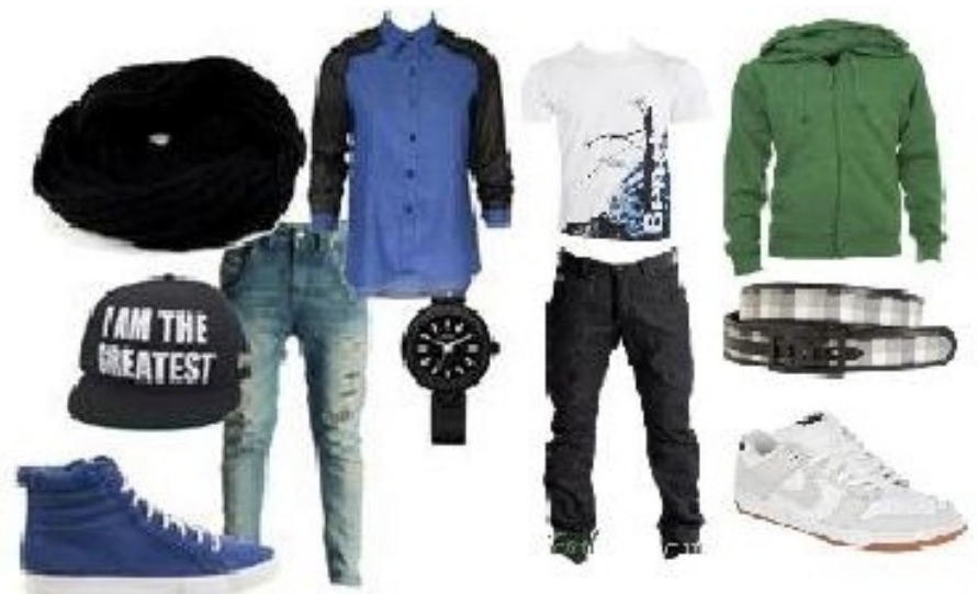
Moje propozycje :)