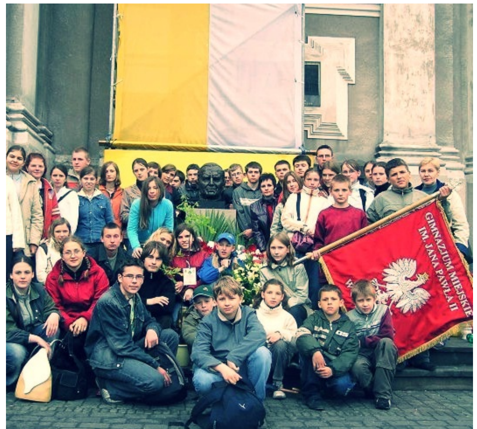
Nasza szkoła w Watykanie

wiary w Boga i ludzi. Zapamiętamy wszyscy, że uczył nie tylko słowem, ale i przykładem własnego życia.