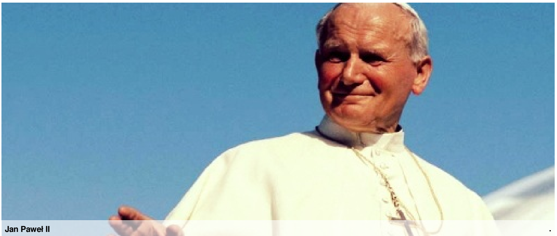
Jan Paweł II

Od 29 maja 2002 roku nasze gimnazjum nosi imię Jana Pawła II , dlatego dzień kanonizacji był również dla nas niezwykły. W tym wydaniu gazetki przypominamy najważniejsze wydarzenia związane z nadaniem szkole imienia Papieża-Polaka oraz spróbujemy odpowiedzieć na pytanie, jaką rolę spełnia patron w życiu szkoły i uczniów.