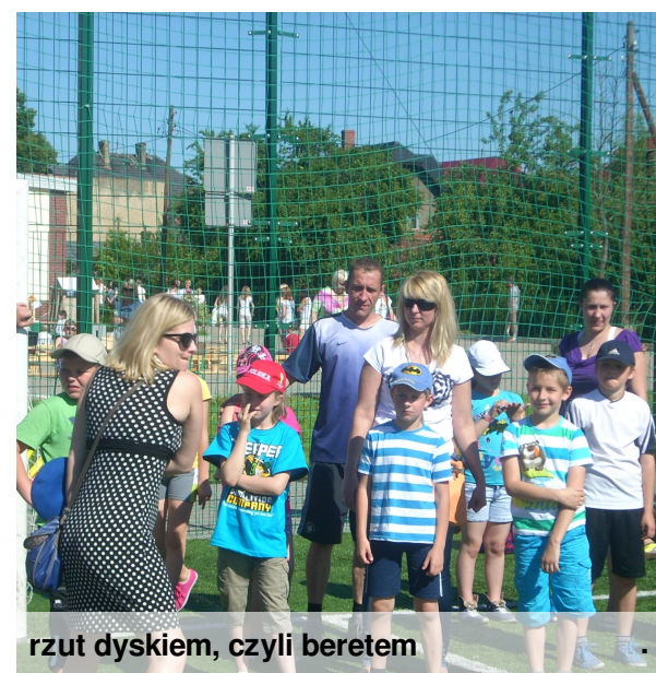
rzut dyskiem, czyli beretem