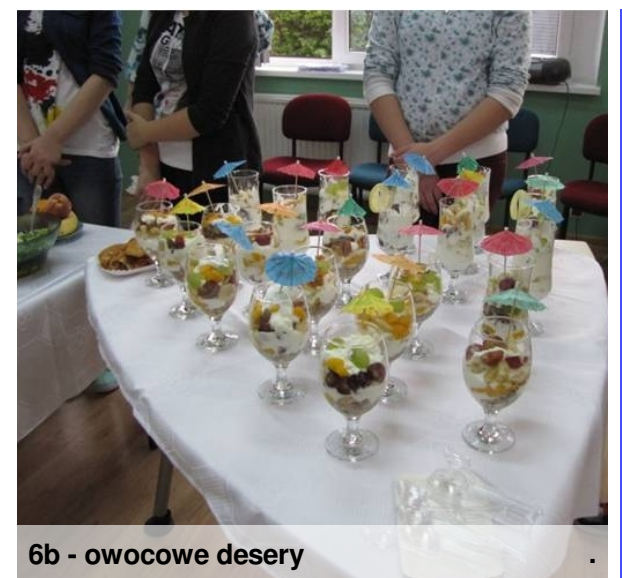
6b - owocowe desery