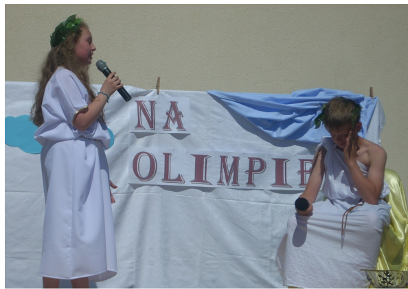
przedstawienie na "Olimpie"