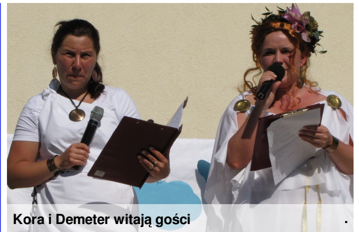
Kora i Demeter witają gości