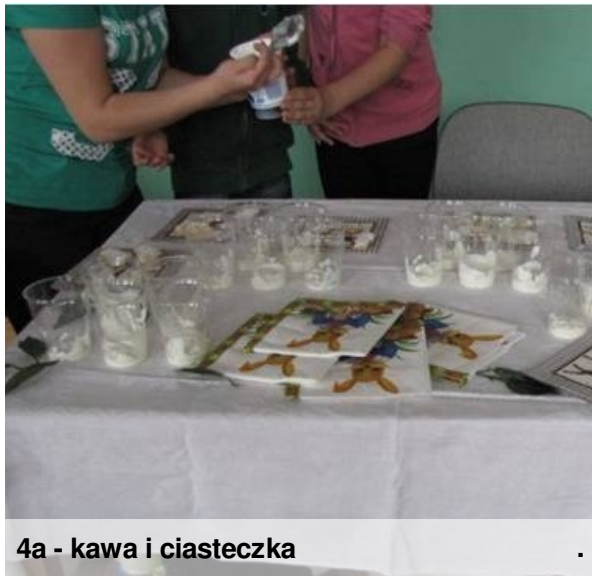
4a - kawa i ciasteczka