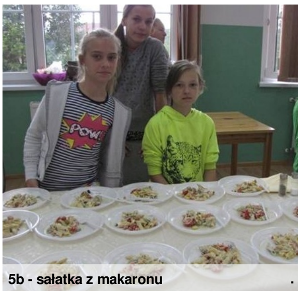
5b - sałatka z makaronu