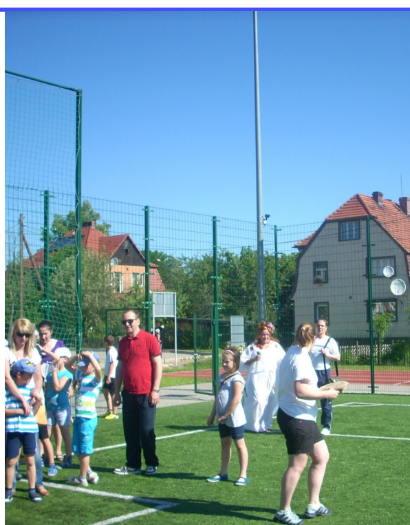
przygotowania do konkurencji

Następnie odbył się mecz piłki ręcznej uczniowie kontra nauczyciele i rodzice. Po zaciętej rozgrywce nauczyciele pokonali żeńską reprezentację uczniów 11:7. Natomiast męska drużyna uczniów rozegrała mecz piłki halowej przeciwko nauczycielom i rodzicom. Tu lepsi okazali się uczniowie. Doping w obu meczach był niesamowity.