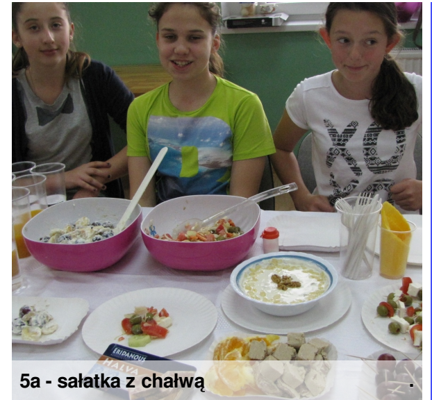
5a - sałatka z chałwą