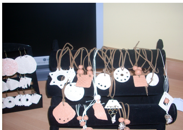
stoisko z glinianą biżuterią