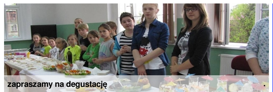
zapraszamy na degustację

Na długiej przerwie odbyła się degustacja potraw przygotowanych przez przedstawicieli klas. Uczniowie mogli najeść się do syta. Było pyyyyszne! Greckie smakołyki wszystkim bardzo smakowały, a każde danie było inne i wyjątkowe na swój sposób, bo przygotowywane z sercem. Bon Appetit!