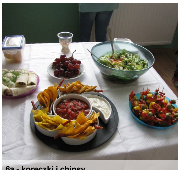
6a - koreczki i chipsy