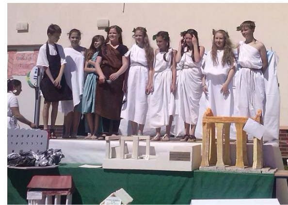
obsada w komplecie