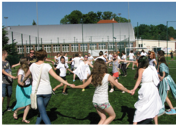
rodzice, uczniowie i nauczyciele