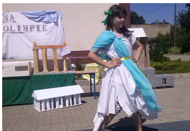
modelka na wybiegu