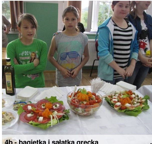
4b - bagietka i sałatka grecka