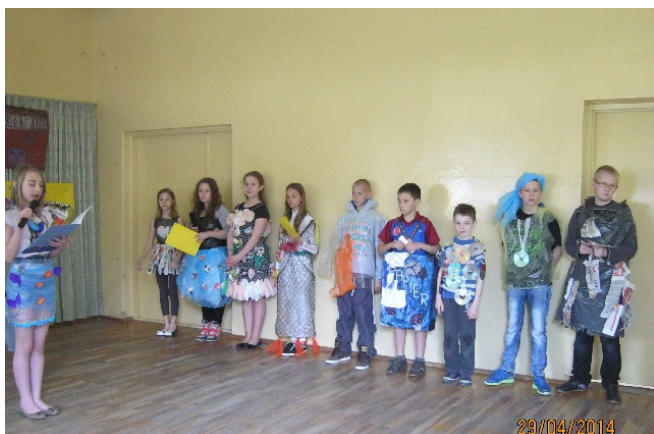
Światowy Dzień Ziemi