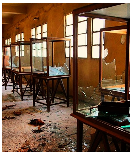
Zniszczony muzeum Marcin Szczepanik

Niektóre zabytki w muzeach są bardzo stare i się mogą zniszczyć więc musimy przestrzegać paru zasad : nie wolno wprowadzać zwierząt, nie można dotykać eksponatów, nie wolno biegać, nie wolno palić papierosów.