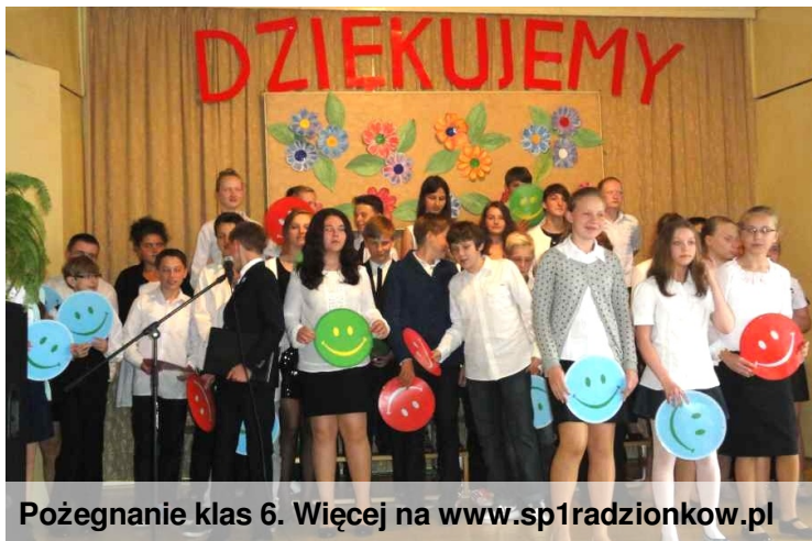
Pożegnanie klas 6. Więcej na www.sp1radzionkow.pl