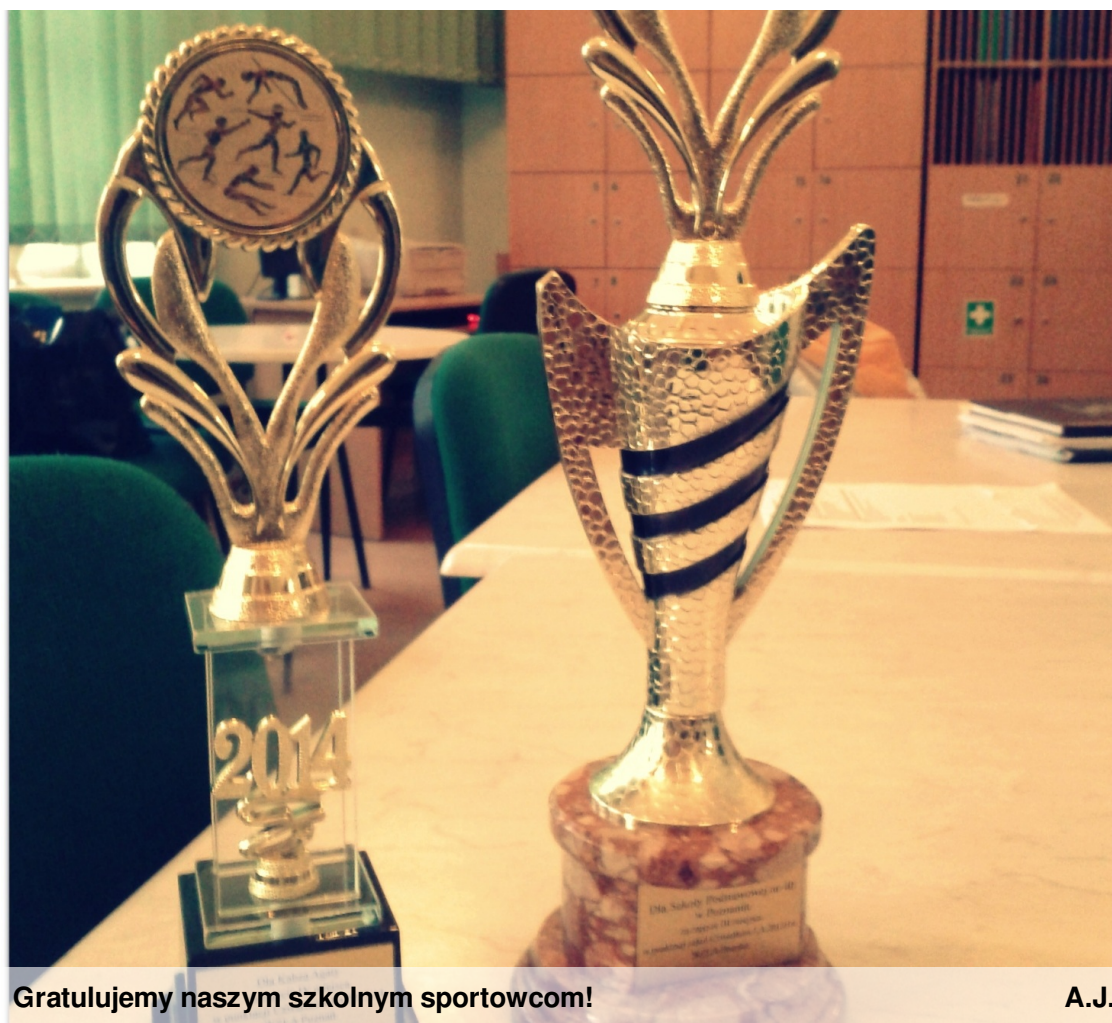
Gratulujemy naszym szkolnym sportowcom!