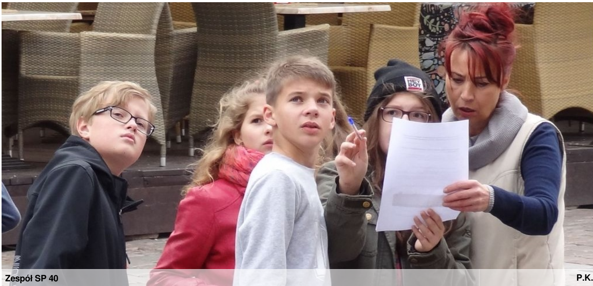
Zespół SP 40