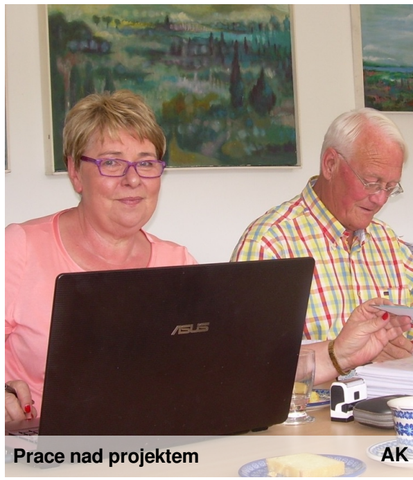
Prace nad projektem