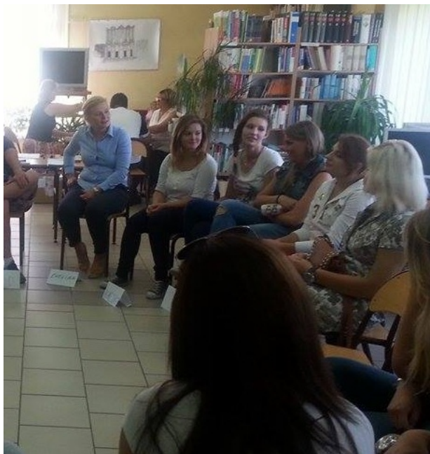
Podczas zajęć przygotowawczych MM