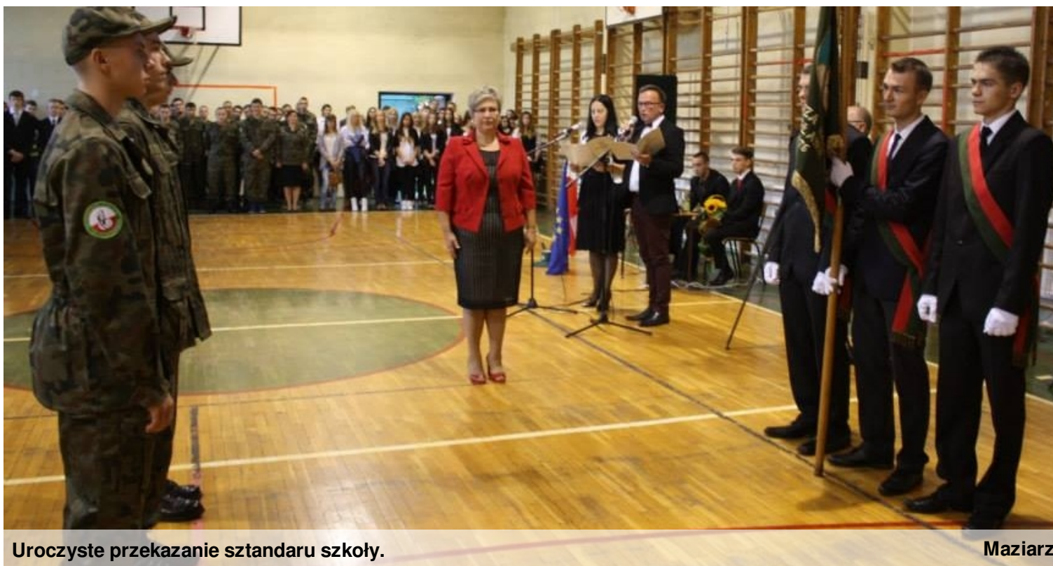
Uroczyste przekazanie sztandaru szkoły.

Przed nami jeszcze jeden numer "Głosu Żubra" i prześlemy pałeczkę młodszym kolegom z pierwszej klasy. Trzymamy za nich kciuki! I za Was również, aby ten rok szkolny był udany!