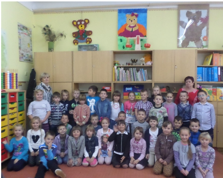
To MY Pierwszaki