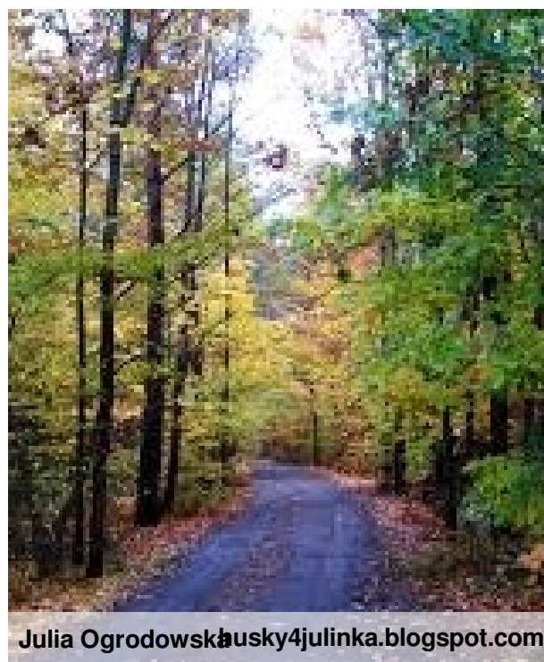
Julia Ogródowska kusky4julinka.blogspot.com