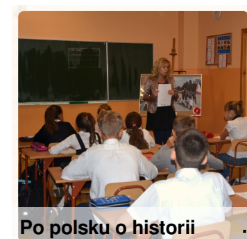
Po polsku o historii

Mistrzowie uczestniczyli w II Małopolskim Dyktandzie Niepodległościowym "Po polsku o historii". Udział wzięło 30 najlepszych ortografów, dwudziestu otrzymało wysoką ilość punktów. Niebawem kolejny etap zmagania. Życzymy powodzenia.