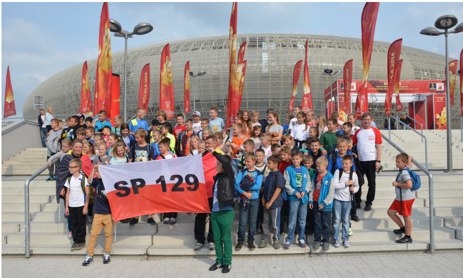
Mistrzostwa Świata Piłki Siatkowej