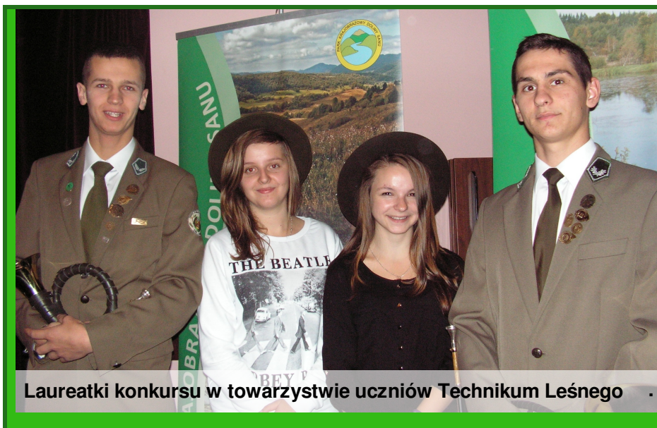
Laureatki konkursu w towarzystwie uczniów Technikum Leśnego