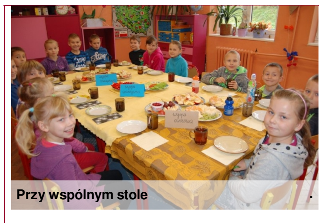
Przy wspólnym stole

Nasza szkoła przyłączyła się do programu "Śniadanie daje moc" i w dniu 7 listopada uczniowie z klasy 1,2 i 3 przygotowali śniadanie w klasie. Dzieciaki miały frajdę nie tylko z dzielenia się z innymi, ale także spróbowania nowych smaków, dowiedzenia się, co lubią na śniadanie inne dzieci i dlaczego właściwie śniadanie jest takie ważne. A dlaczego? Samochód bez benzyny nie zabierze nas na wycieczkę, a uczeń bez śniadania nie będzie miał siły do zabawy i nauki. Jednemu i drugiemu potrzebne jest „paliwo”.