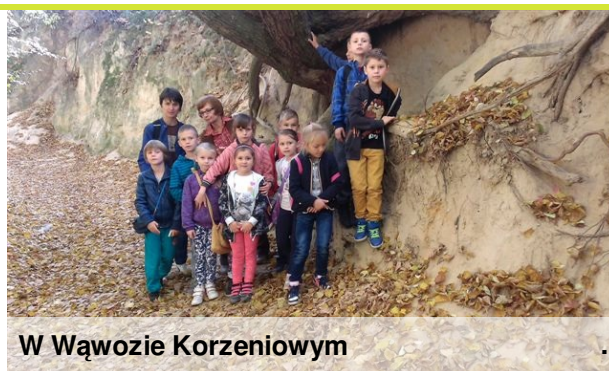
W Wąwozie Korzeniowym

Na nietypową lekcję w terenie wybrała się klasa 1 i 2 do Kazimierza Dolnego. Piękna pogoda im dopisała, Uroki, ciekawostki i historię miasteczka przybliżyła uczniom Pani Dyrektor. Uczniowie spacerowali również Wąwozem Korzeniowym, który jest wyjątkowo piękny jesienią. Wszyscy mile spędzili czas.