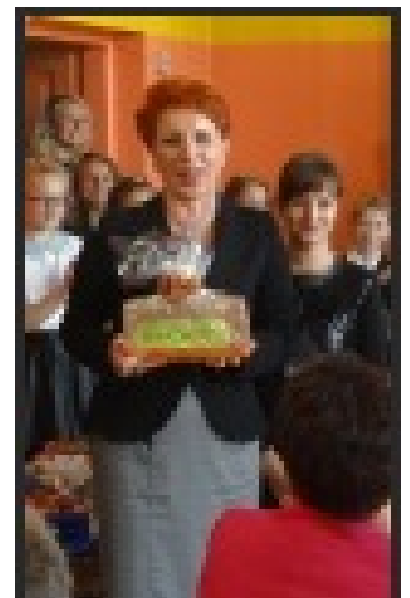
Dzień Nauczyciela R.N

Dzień Edukacji Narodowej - 14 października jest w naszej szkole obchodzony bardzo uroczystie. Przygotowana przez uczniów akademia jest zawsze na wysokim poziomie, a występujący uczniowie są niczym profesjonalni aktorzy. Są kwiaty i życzenia od uczniów i oczywiście rodziców, którzy szczególnie doceniają pracę nauczycieli.