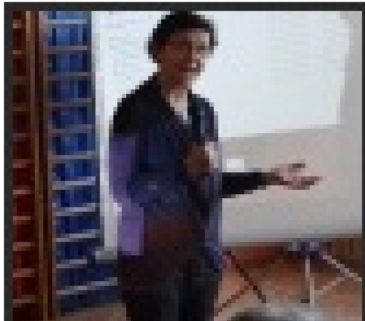
wykład był bardzo ciekawy