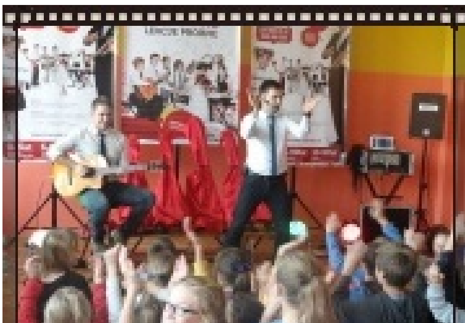
Lubimy takie spotkanie.