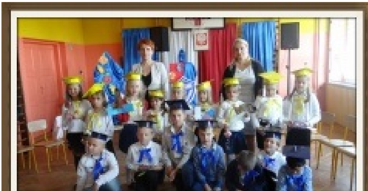
Pierwsza klasa stała się uczniami.