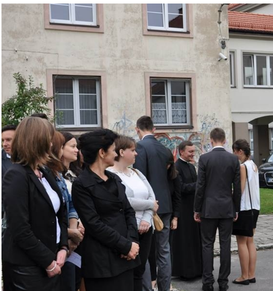
Oto rada pedagogiczna II LO w Wieluniu.