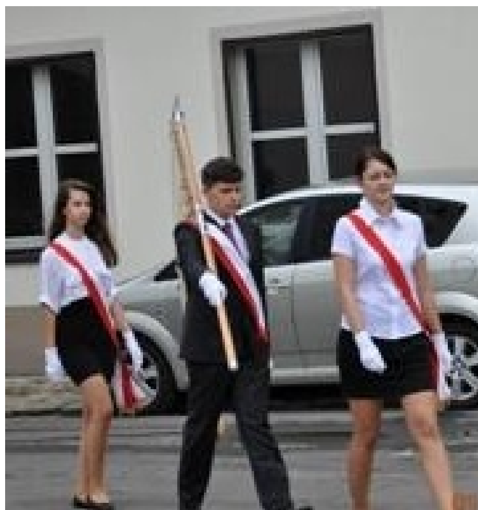
Cała uroczystość zaczęła się od wprowadzenia sztandaru szkoły.