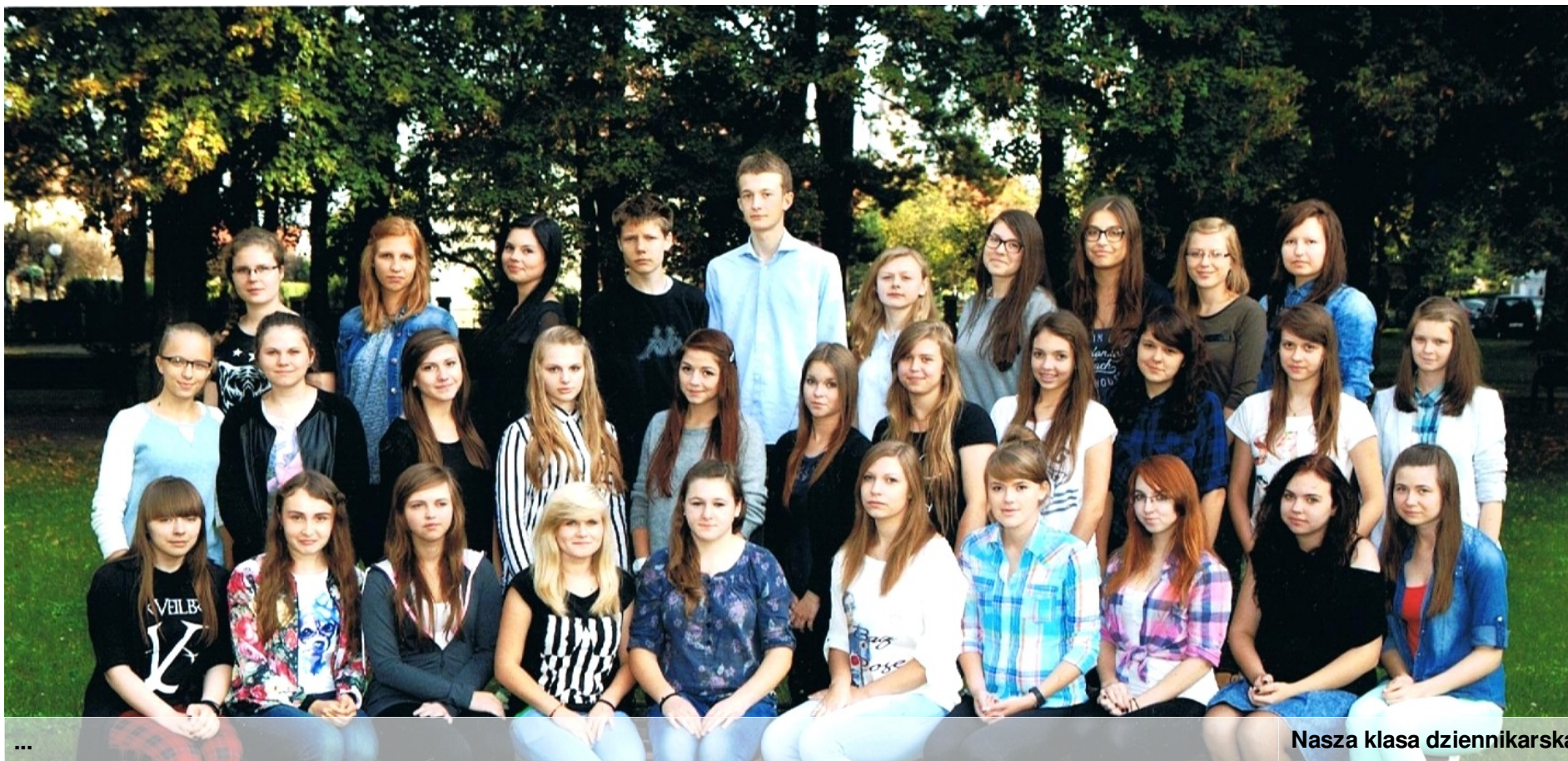
Nasza klasa dziennikarska