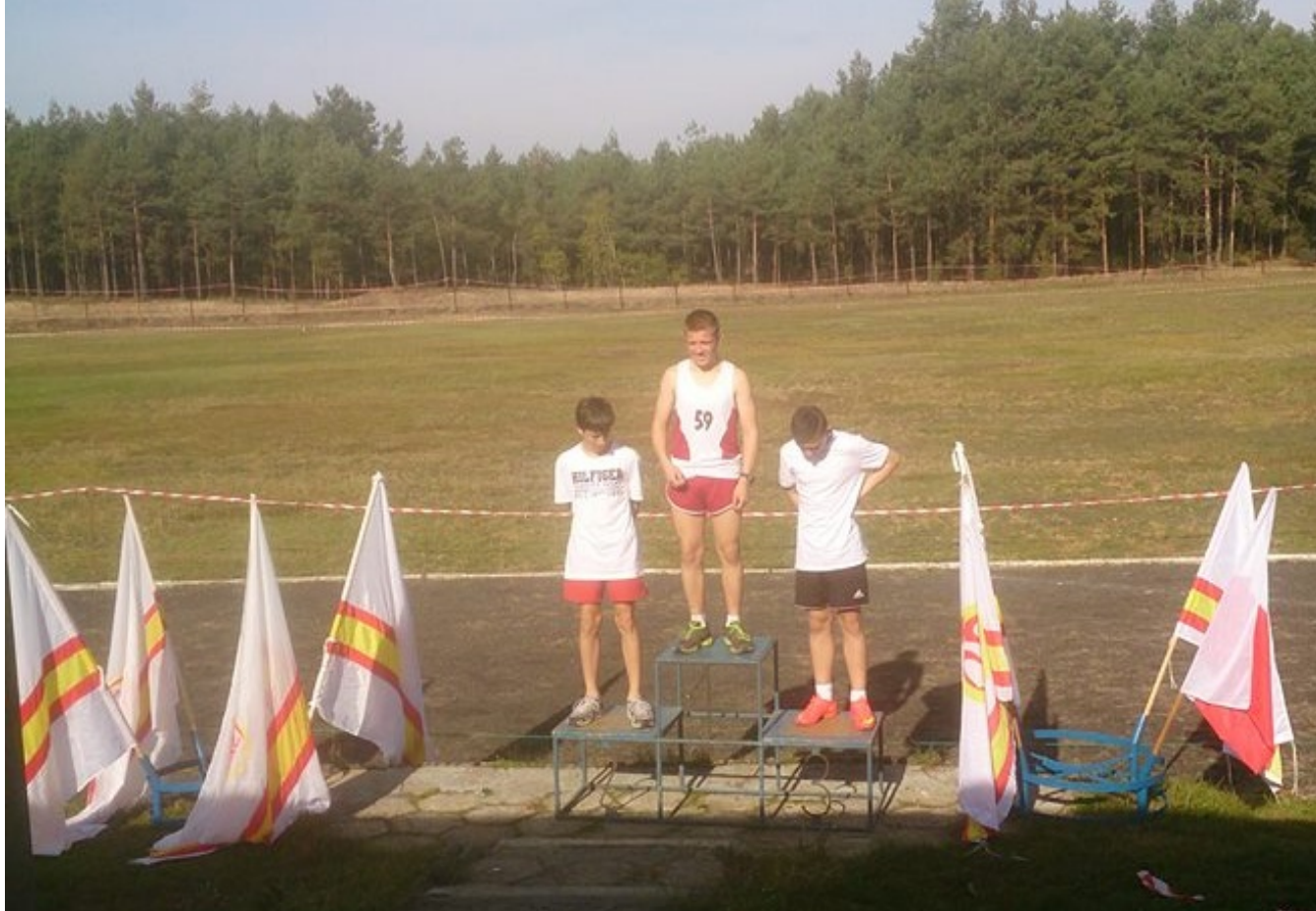
Kuba na podium