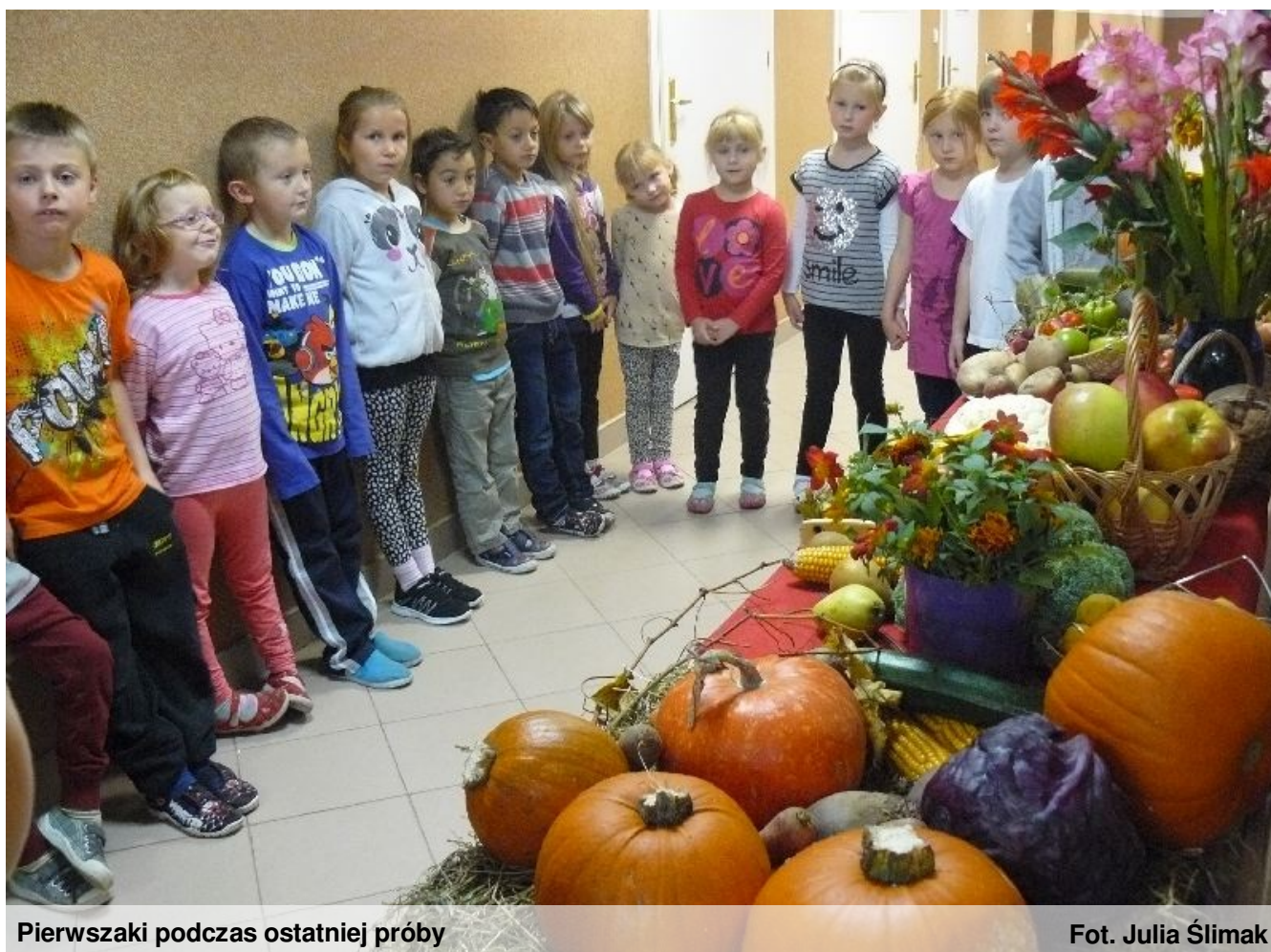
Pierwszaki podczas ostatniej próby