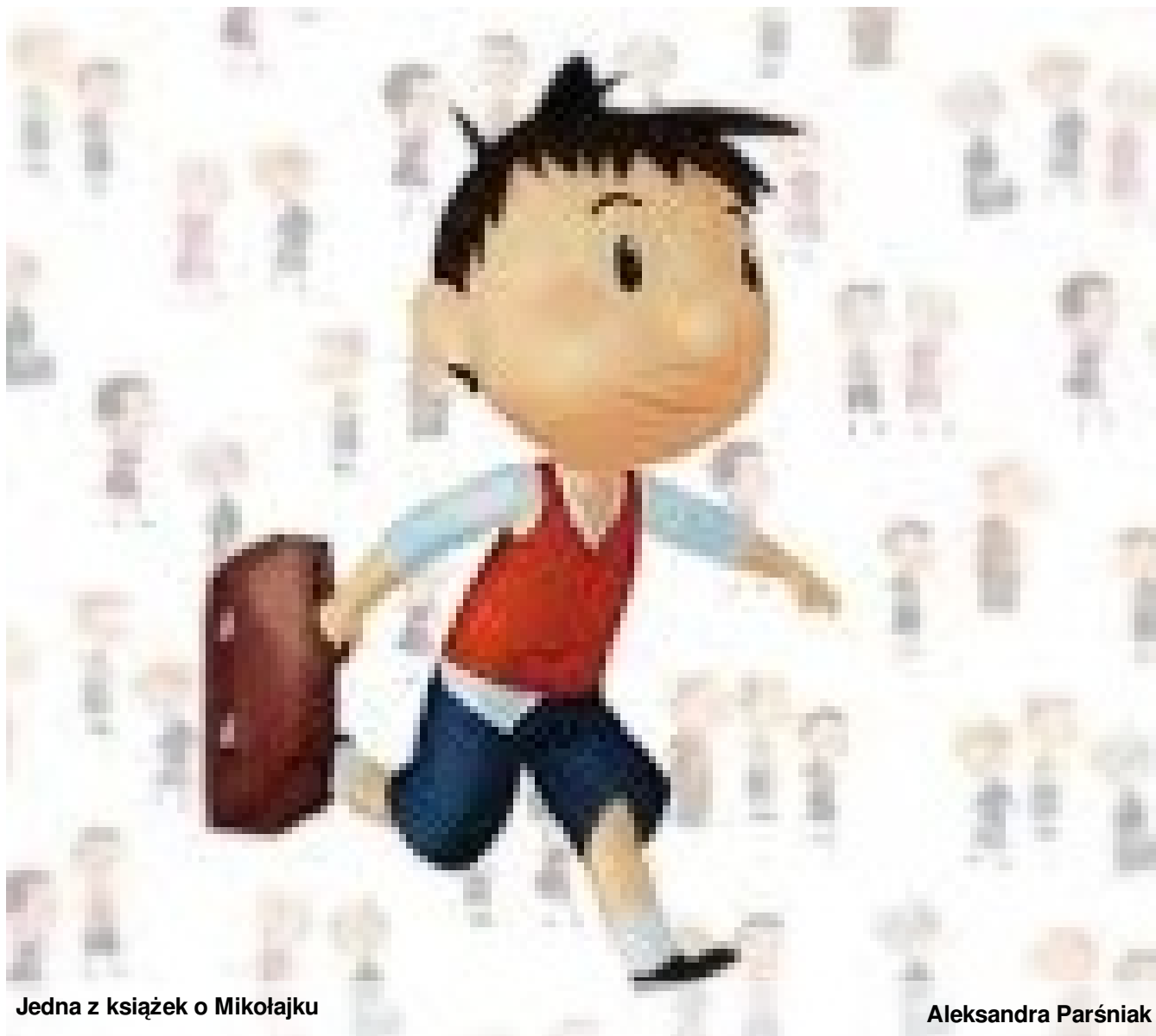
Jedna z książek o Mikołajku