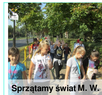
Sprzątamy świat M. W.

Nasza szkoła przy współpracy Zarządu Dróg i Zieleni w Pile, uczestniczyła w akcji Sprzątania Świata 2014. Wszystkie klasy zebrały wiele worków śmieci i pomogły przywrócić czystość w naszym mieście.