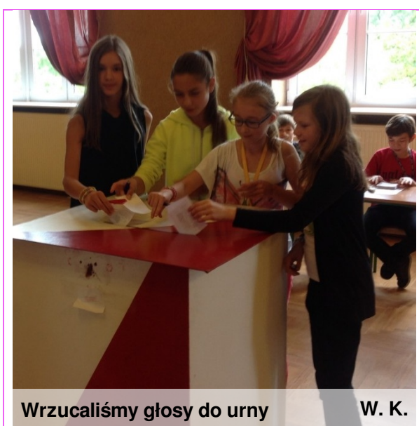
Wrzucaliśmy głosy do urny