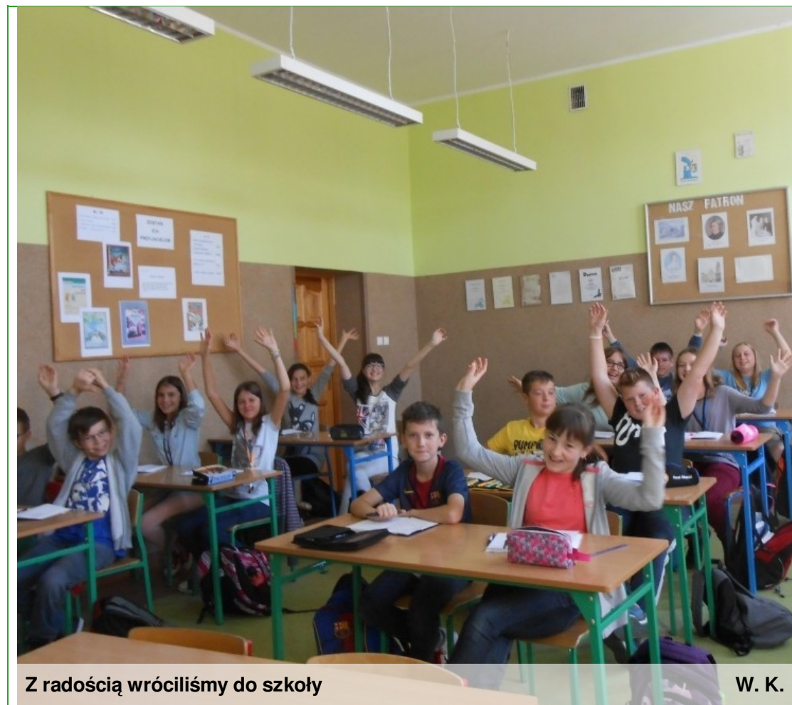
Z radością wróciliśmy do szkoły