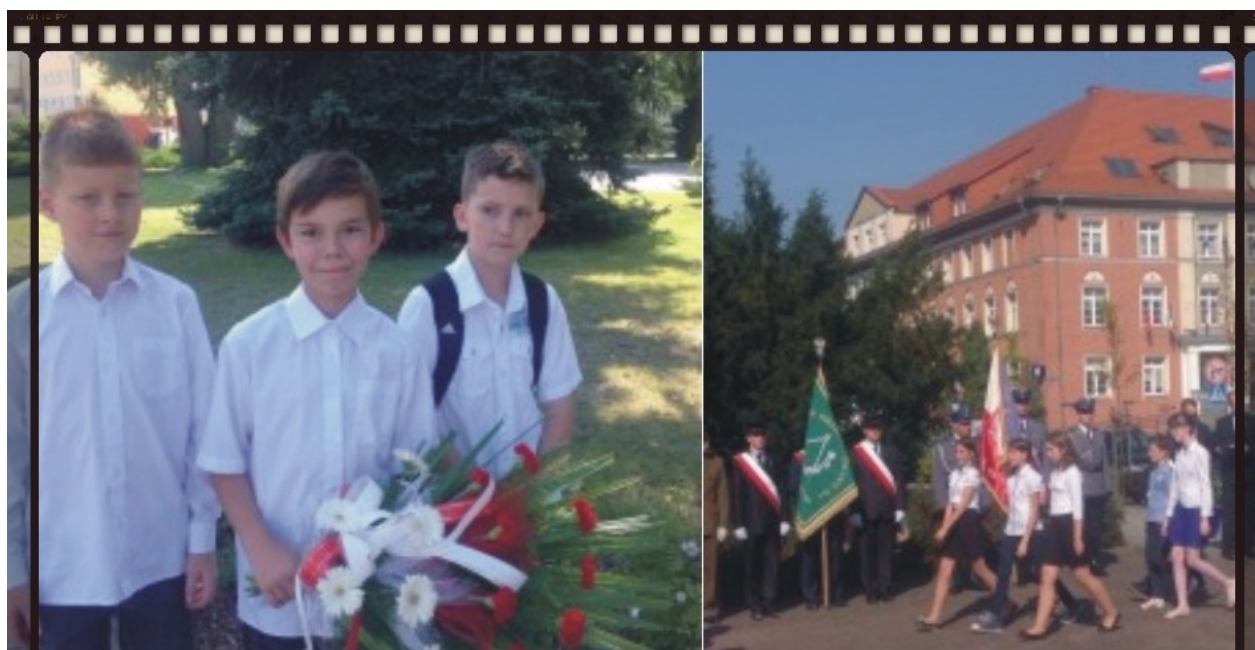
Nasza reprezentacja na obchodach