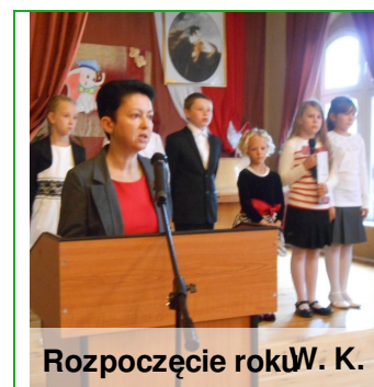
Rozpoczęcie roku W. K.

Grono uczniowskie powiększyło się i ten rok szkolny rozpoczęło aż 453 uczniów, w tym 111 pierwszoklasistów. Szczególnie im życzymy, aby szkoła była drugim domem, w którym będą chętnie przebywać i czuć się bezpiecznie.