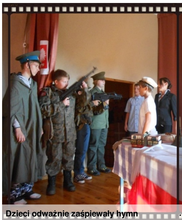
Dzieci odważnie zaśpiewały hymn