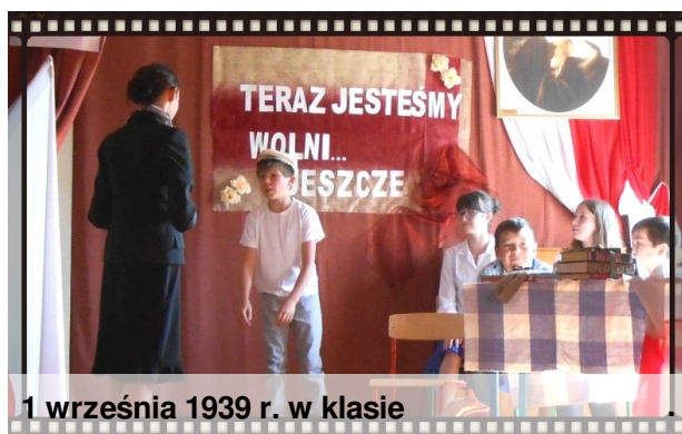
1 września 1939 r. w klasie