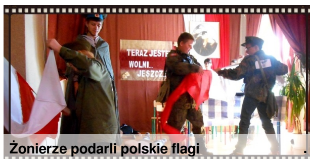
Żonierze podarali polskie flagi