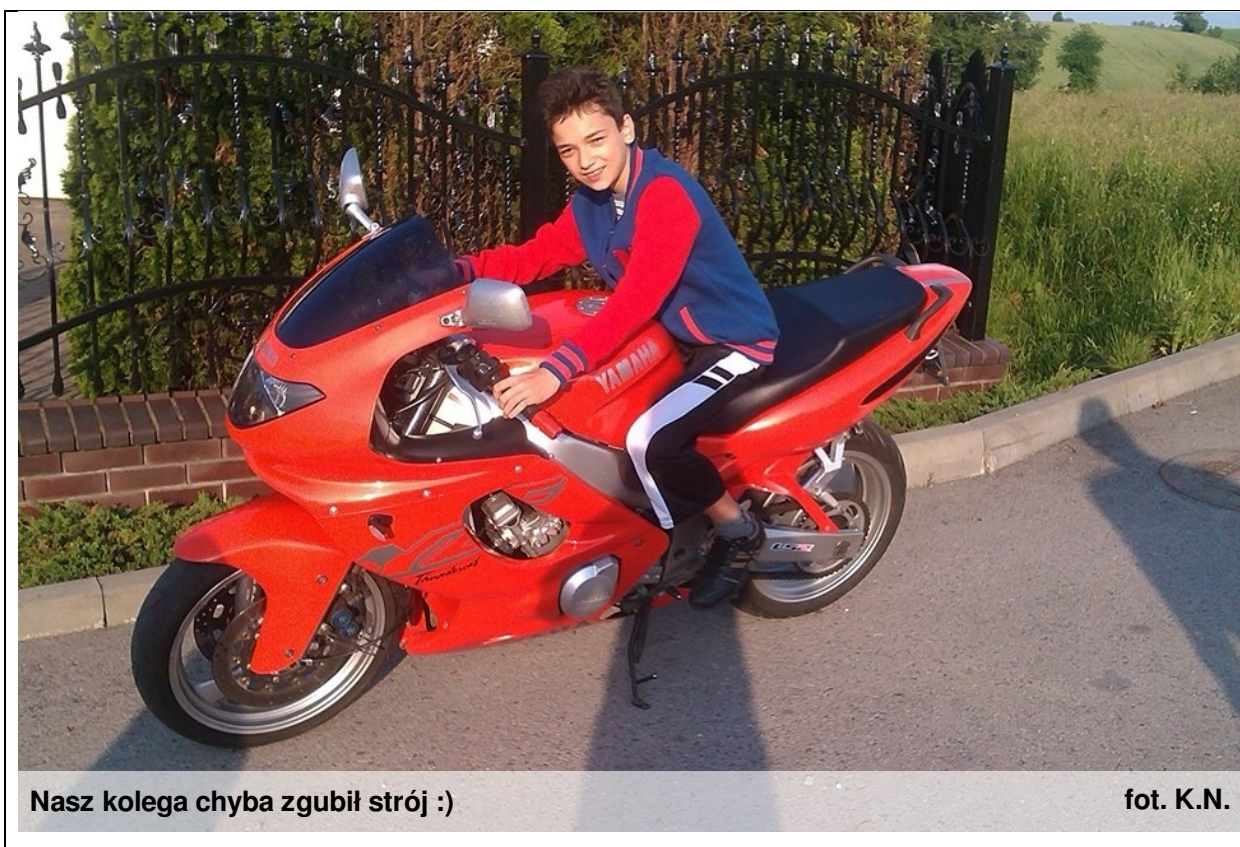
Nasz kolega chyba zgubił strój :)