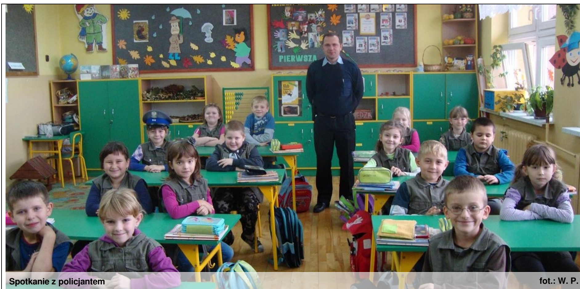
Spotkanie z policjantem