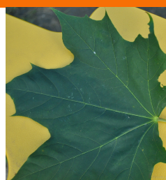
Liść nr 1 J.P.