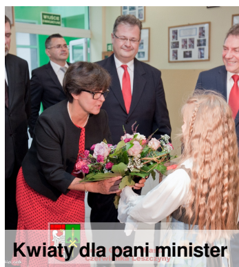
Kwiaty dla pani minister