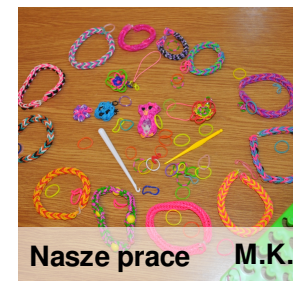
Nasze prace M.K.