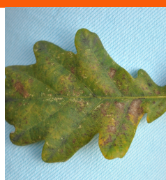
Liść nr 2 J.P.