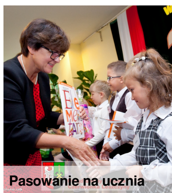
Pasowanie na ucznia