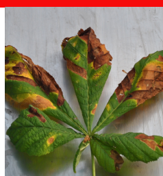
Liść nr 4 J.P.