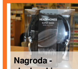
Nagroda - słuchawki