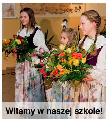
Witamy w naszej szkole!