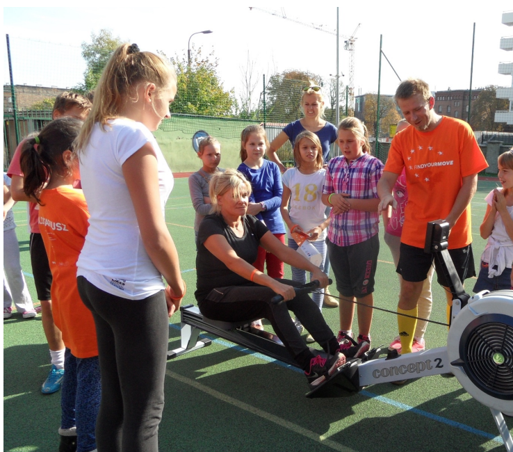
Rywalizacja na ergometrze