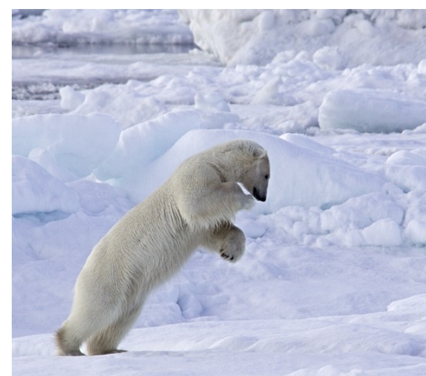
Podczas polowania

Niektórzy ludzie widzą niedźwiedzia polarnego jako miłutkiego miśka, ale niech Was pozory nie mylą. Niedźwiedzie te są jednymi z najlepszych myśliwych w świecie zwierząt.