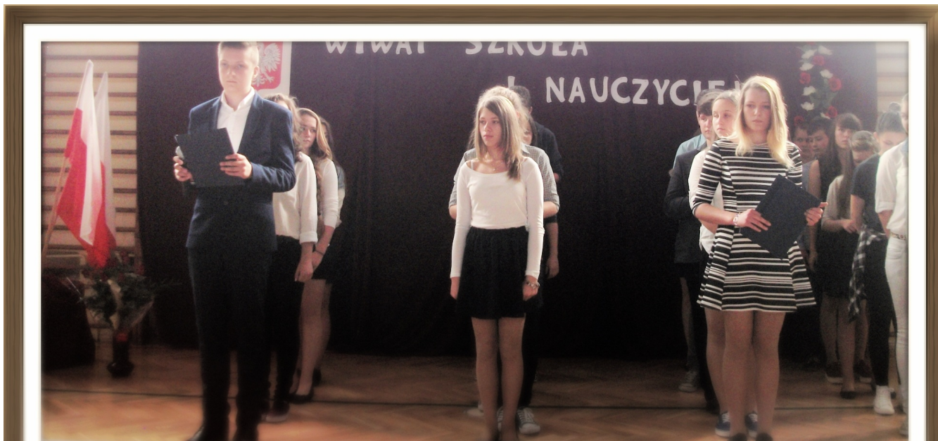
prezentacja Samorządu Szkolnego Gimnazjum w Sulejowie