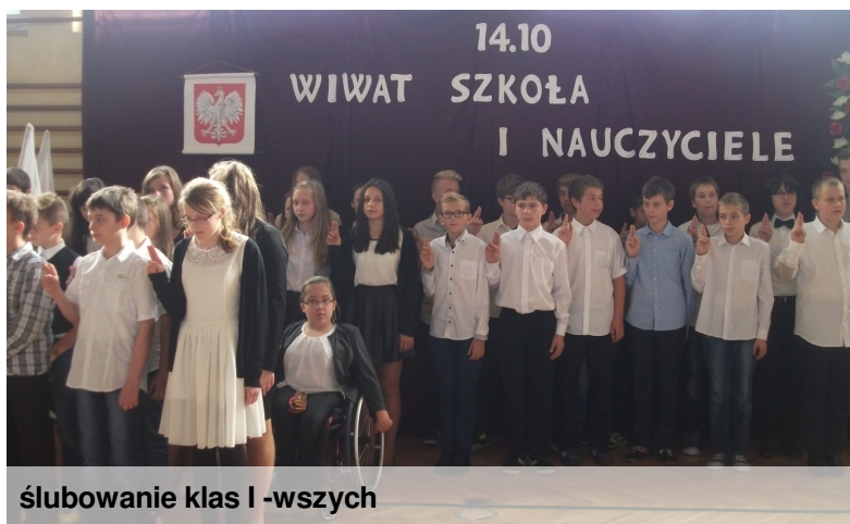
ślubowanie klas I -wszych