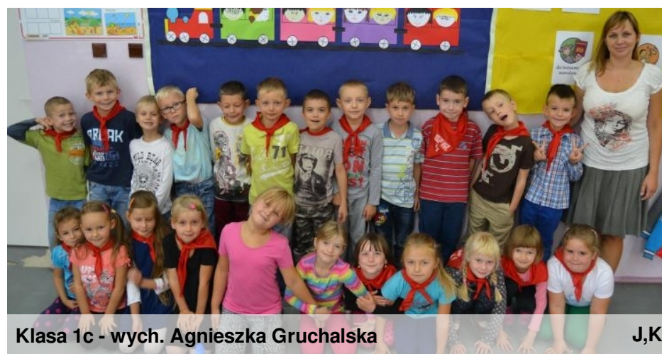
Klasa 1c - wych. Agnieszka Gruchalska