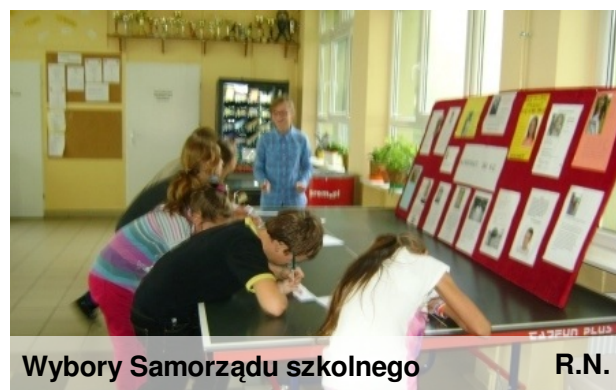
Wybory Samorządu szkolnego