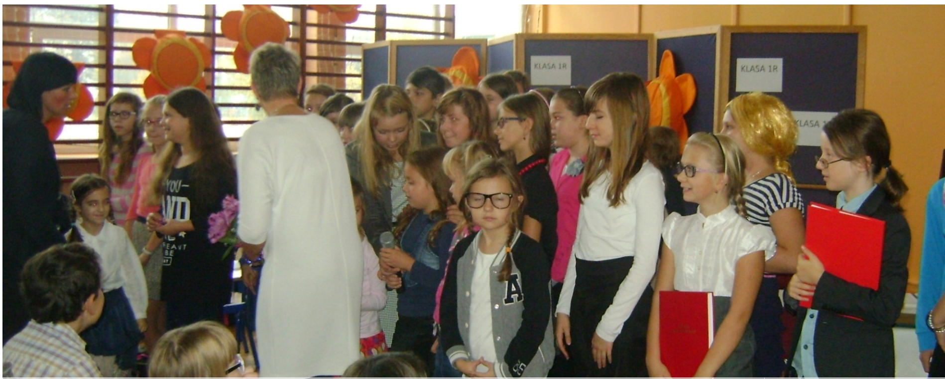
Zespół koła teatralnego z opiekunkami po występie z okazji DEN