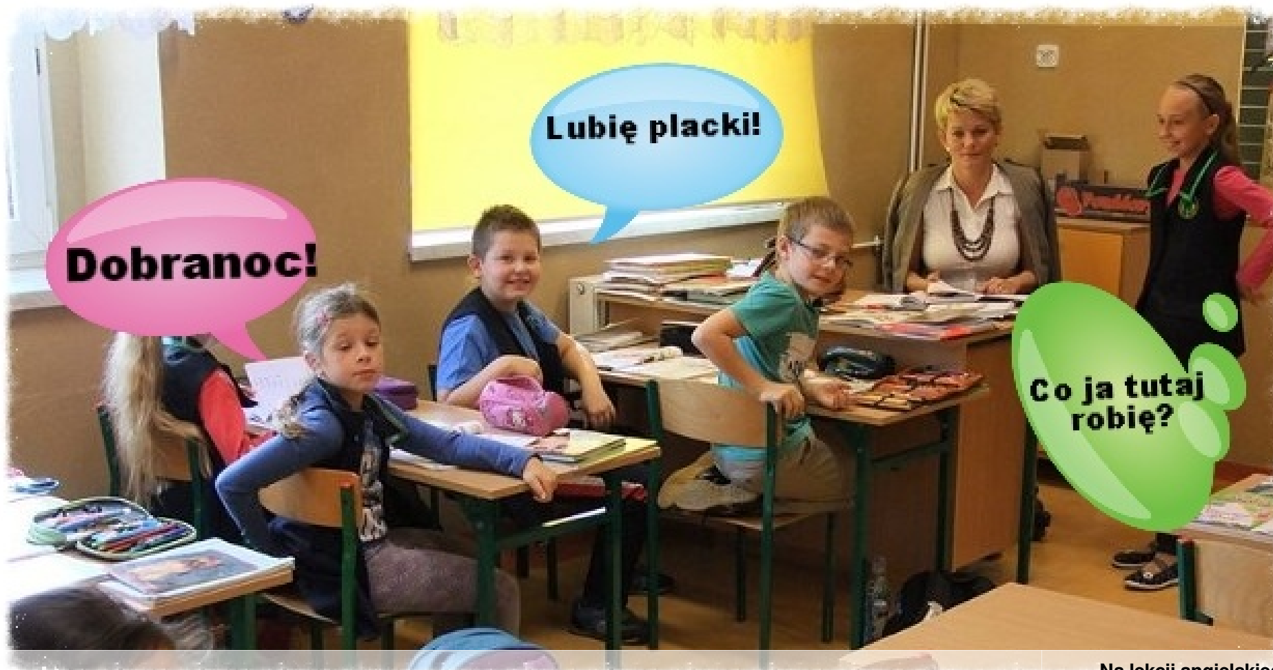
Na lekcji angielskiego