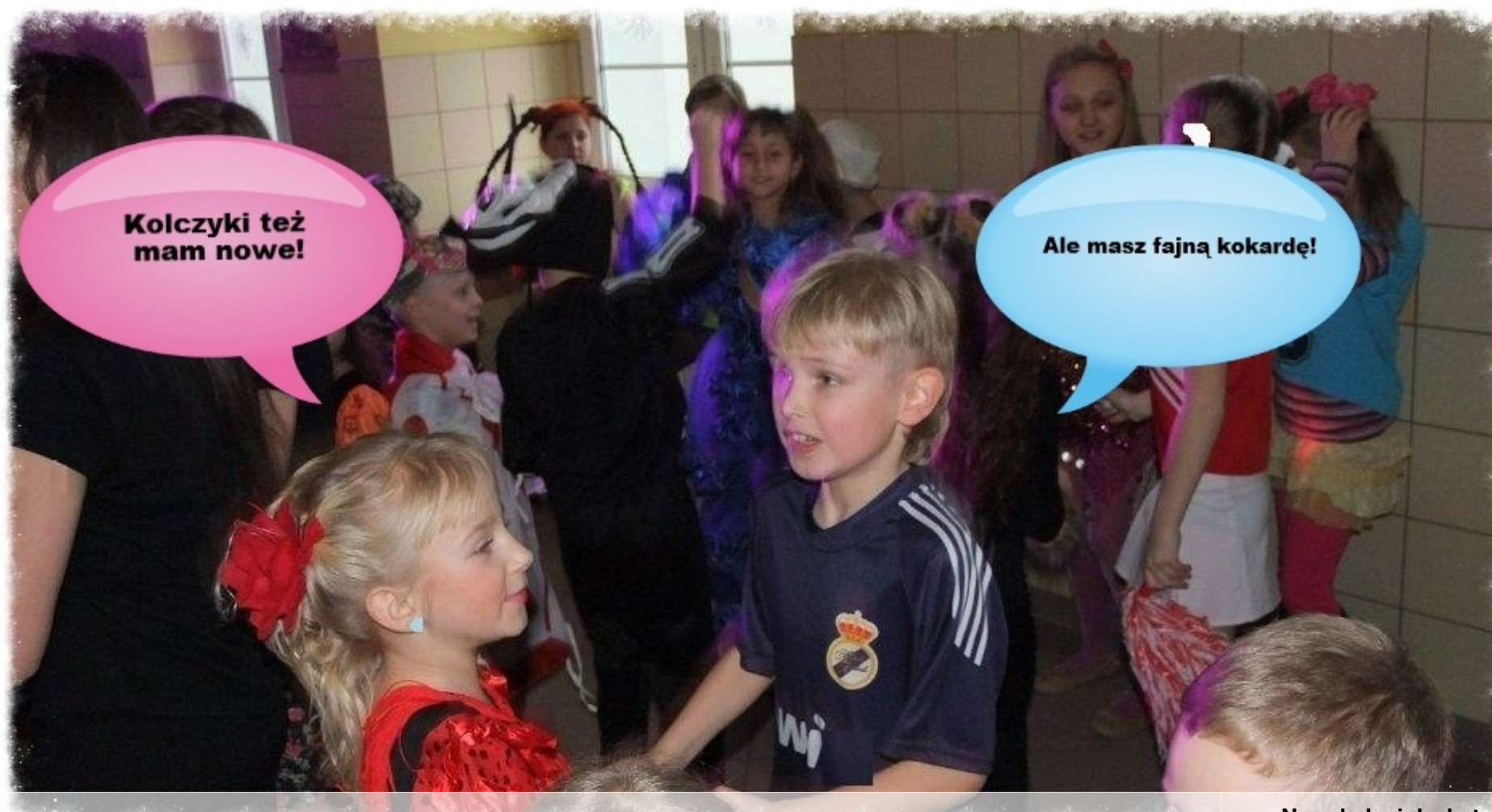
Na szkolnej dyskotecce