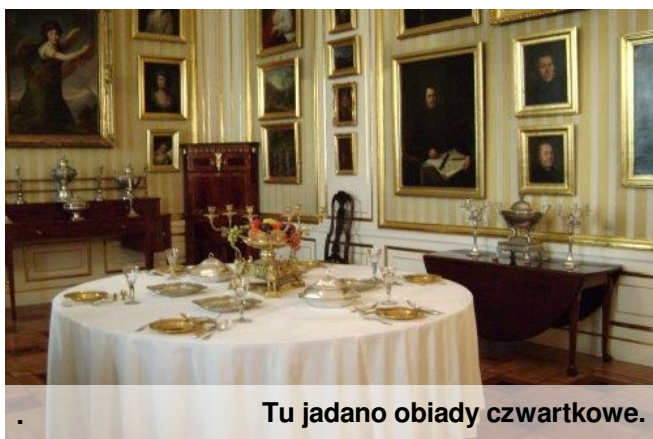
Tu jadano obiady czwartkowe.