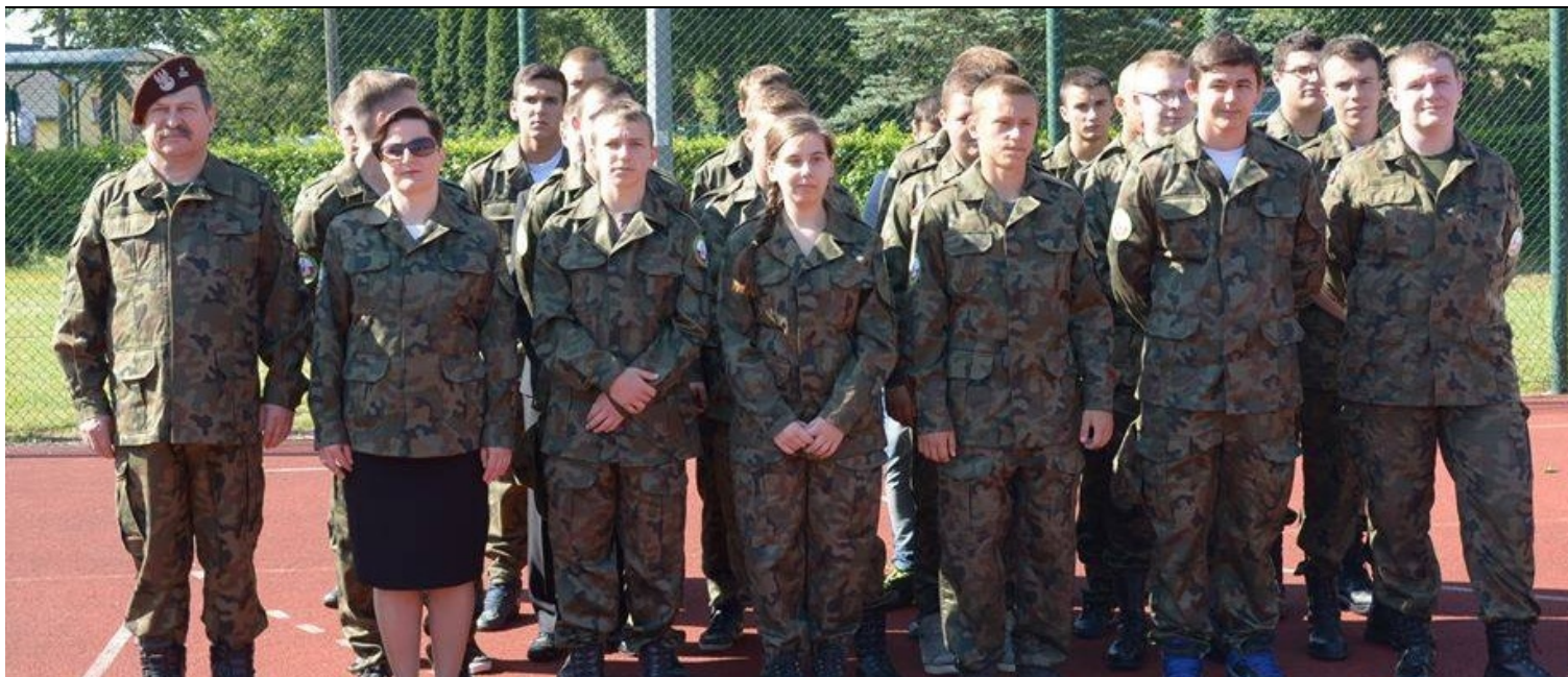
Tak dobrze prezentuje się tylko klasa mundurowa.