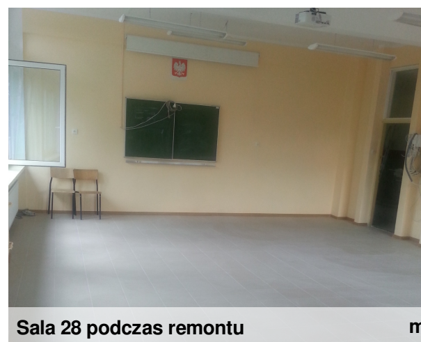
Sala 28 podczas remontu