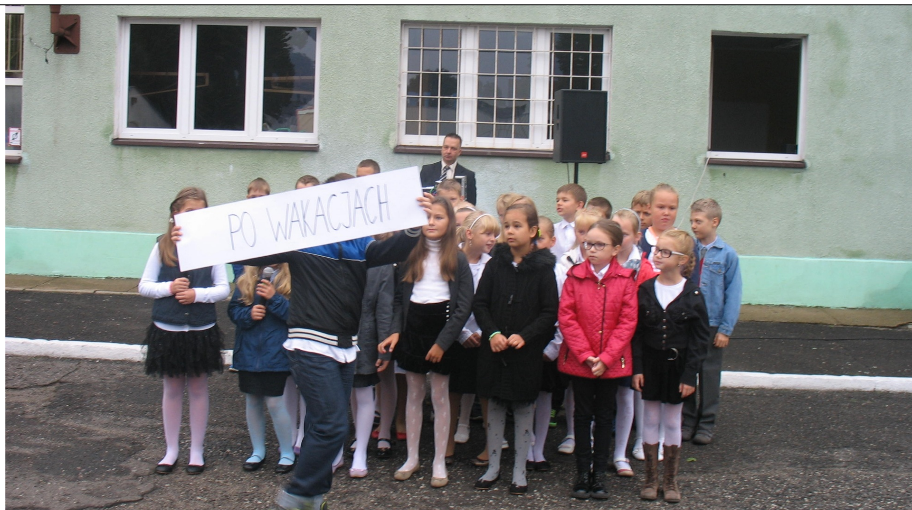
Rozpoczęcie roku szkolnego