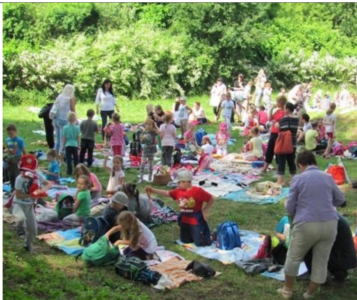
Piknik nie był tylko nazwą