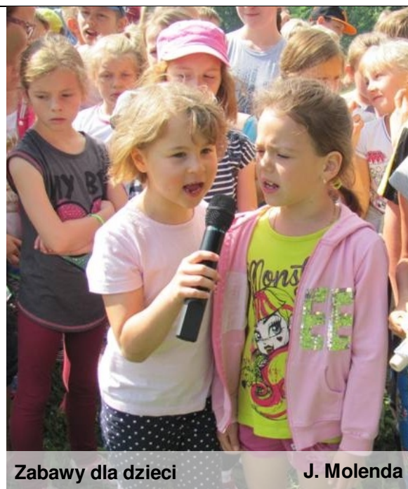
Zabawy dla dzieci

W niedzielę 14 września 2014 roku odbył się I Powiatowy Piknik Naukowy we Wrześni. Do parku im. Dzieci Wrzesińskich przybyły tłumy - zarówno rodzice, jak i dzieci. Wszystko po to, by poznać naukę w praktyce, a nie tylko w teorii. Każdy bowiem mógł znaleźć dla siebie coś interesującego. Na szczęście pogoda i frekwencja dopisały i wszystko przebiegło zgodnie z planem!