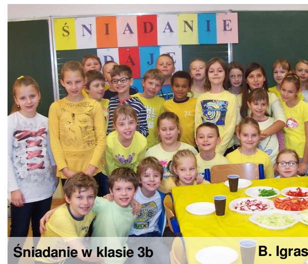
Śniadanie w klasie 3b

W dniu 7.11.2014 roku w naszej szkole klasy młodsze zorganizowały w swoich salach wspólne śniadanie. W ten sposób uczniowie wzięli udział w Dniu Śniadanie Daje Moc. Uczniowie z poszczególnych klas przynieśli do szkoły tylko zdrowe produkty, z których przygotowali najważniejszy posiłek dnia – śniadanie. Pracując w zespołach uczniowie zrobili smaczne i zdrowe kanapki, a przy okazji mogli dowiedzieć się, dlaczego śniadanie jest ważne dla każdego z nich. W klasach pierwszych do pracy włączyli się rodzice, którzy pomagali najmłodszym w przygotowywaniu posiłku. Kiedy wszystko już było przygotowane uczniowie zasiedli do stołu i wspólnie zjedli śniadanie, które było zdrowe i kolorowe. Oprócz kanapek na talerzach uczniów znalazły się owoce: jabłka, winogrona, gruszki, mandarynki oraz warzywa: papryka, sałata, pomidory, ogórki, rzodkiewki. Każdy miał możliwość skomponowania swojego śniadania. Apetyt na takie śniadanie stale rośnie.