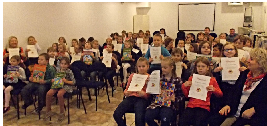
Laureaci konkursu z nagrodami

Poniżej zdjęcia z wystawy pokonkursowej.