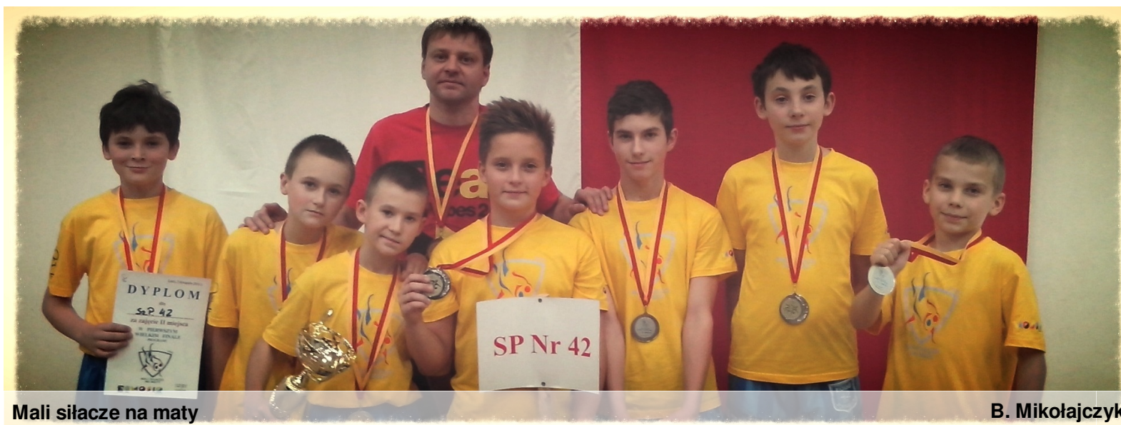
Mali siłacze na maty