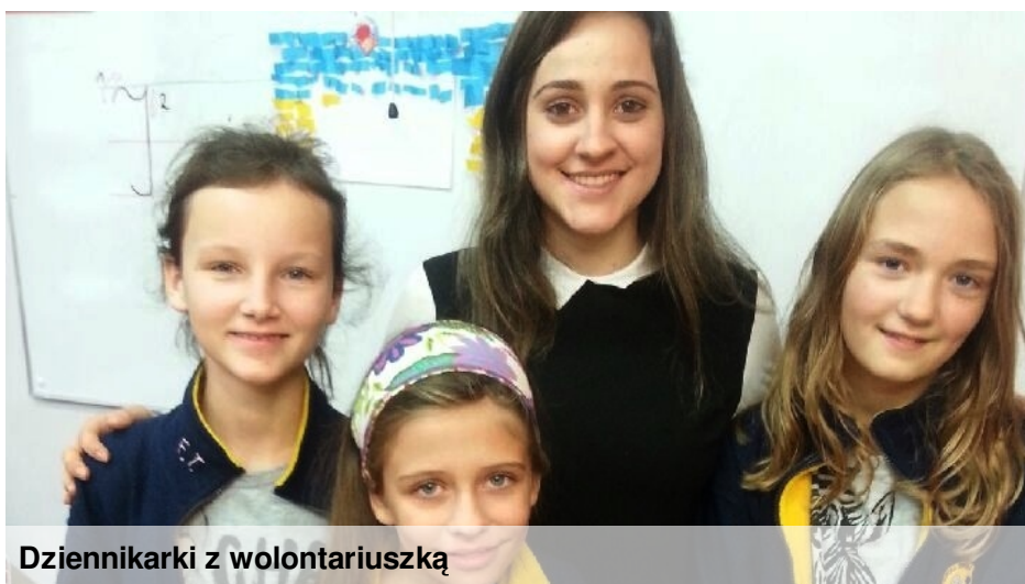
Dziennikarki z wolontariuszką