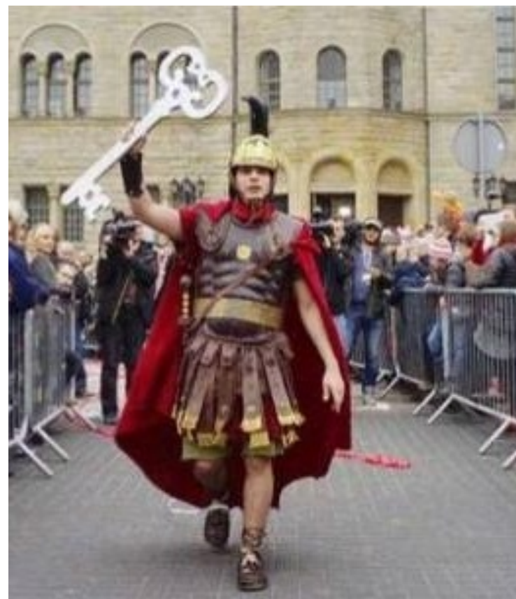
Imieniny Ulicy Św. Marcin

Zakończenie tego radosnego dnia stanowił pokaz sztucznych ogni.