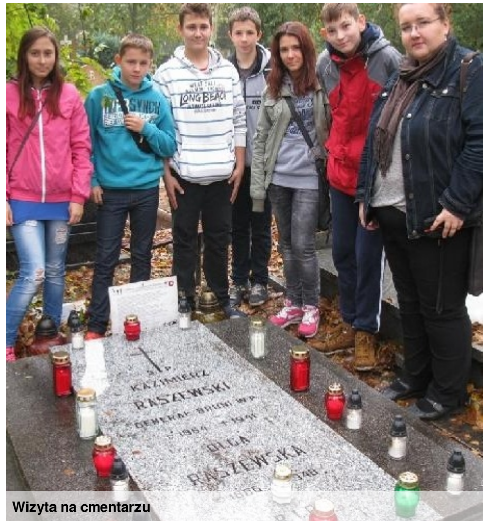
Wizyta na cmentarzu