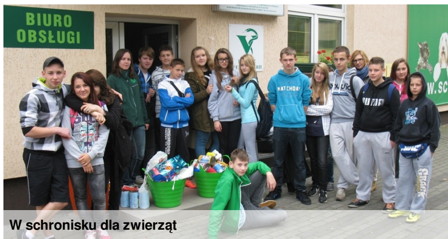
W schronisku dla zwierząt