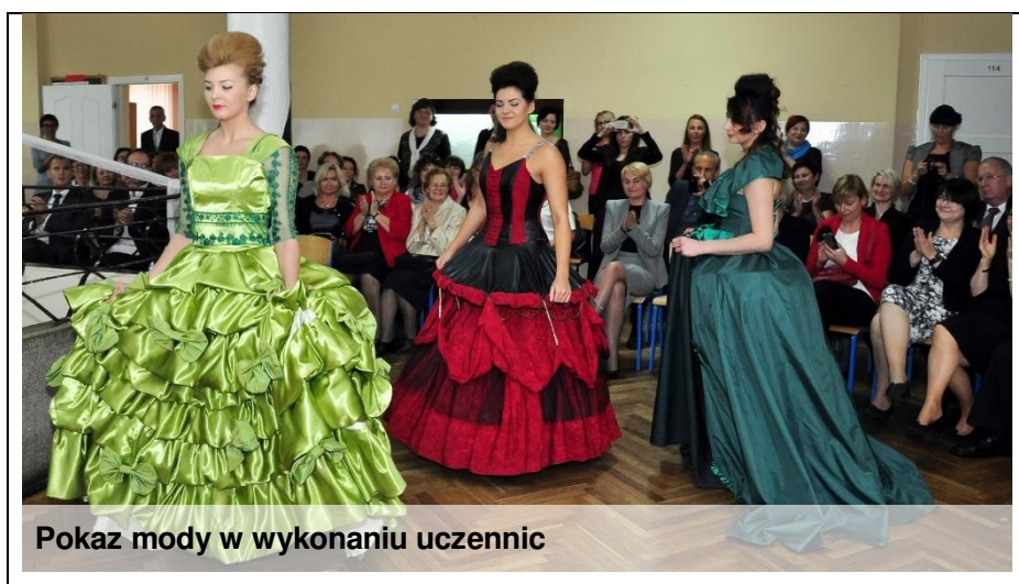
Pokaz mody w wykonaniu uczennic