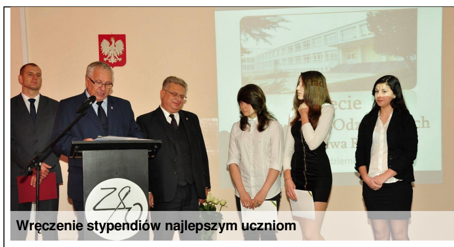
Wręczenie stypendiów najlepszym uczniom