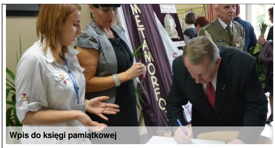
Wpis do księgi pamiątkowej