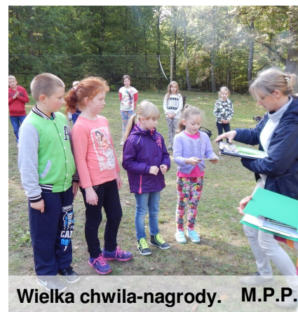
Wielka chwila-nagrody. M.P.P.