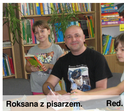
Roksana z pisarzem.