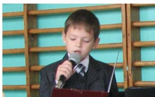
Konferansjer Kuba. Red.