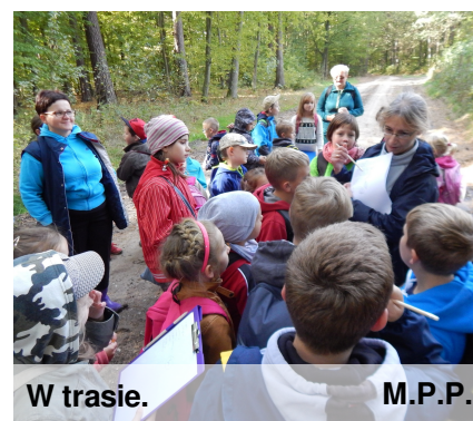
W trasie. M.P.P.