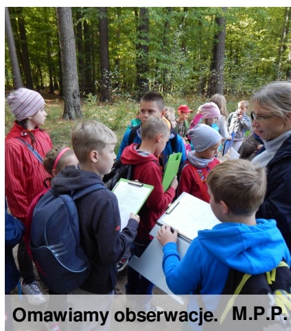
Omawiamy obserwacje. M.P.P.