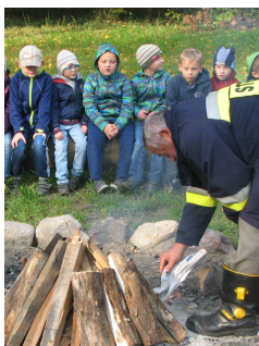
Pali się! Red.

Po powrocie do szkoły zasiedlimy do ziemniaczano - kielbaskowej uczty.