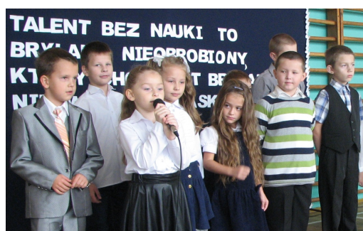
Występ II klasy. Red.

Mamy nadzieję, że się podobało, bo nasi nauczyciele są super!