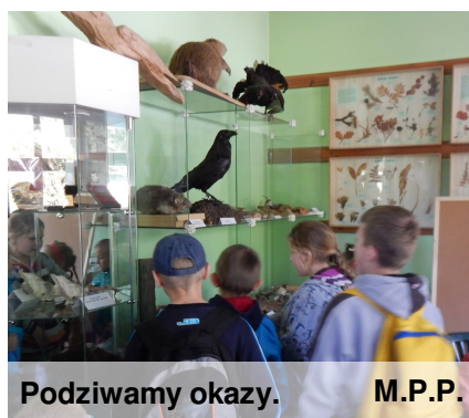
Podziwiamy okazy. M.P.P.

Ponieważ solidnie zgłodnieliśmy, organizatorzy przygotowali dla nas pyszny poczęstunek - kielbaski pieczone na ogniu i inne smakołyki.