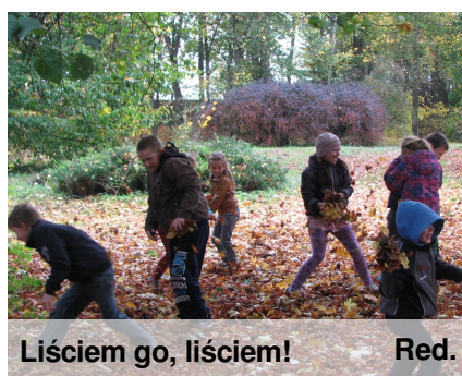
Liściem go, liściem!