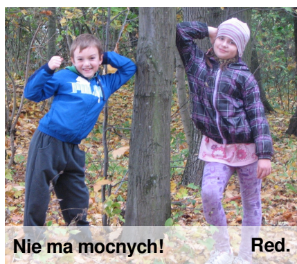
Nie ma mocnych!