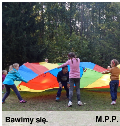
Bawimy się. M.P.P.