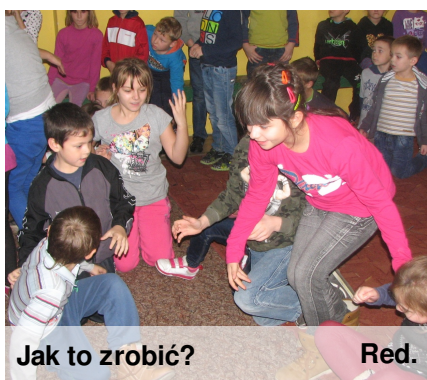
Jak to zrobić?