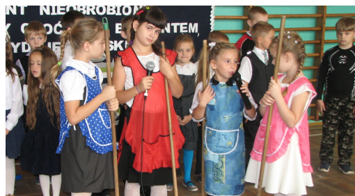
Nasze gwiazdeczki. Red.