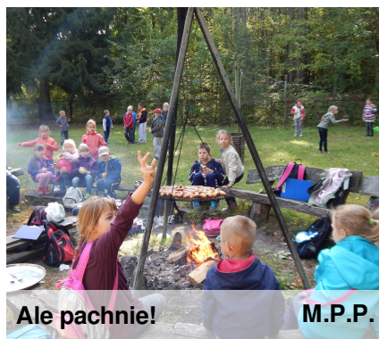
Ale pachnie! M.P.P.