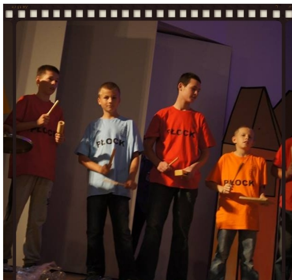
Występ w Szkole Muzycznej