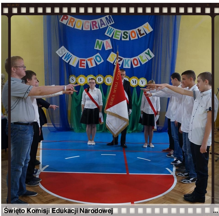
Święto Komisji Edukacji Narodowej