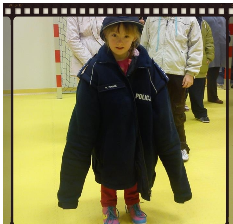
Na komendzie ...

metody ściągnięcia linii papilarnych, a najwięcej radości spowodowało przymierzanie stroju, w którym występują policjanci podczas zamieszek ulicznych i awantur na stadionach piłkarskich.